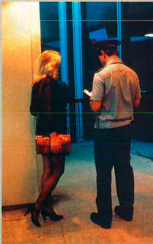
Viure: prioritat de la dona russa.

40 dòlars es pot obtenir una cinta amb quaranta dones, de vint-i-un any a trenta-cinc, en banyador.