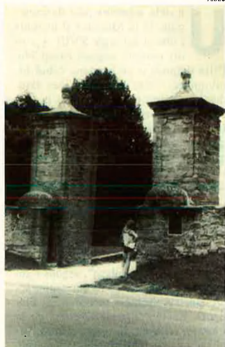
A l'esquerra, castell de Sant Marc. A la dreta, antic portal de la ciutat, tots dos a Sant Agustí. La colònia menorquina és la més antiga, nombrosa i permanent a Nord-amèrica de gent procedent dels Països Catalans.