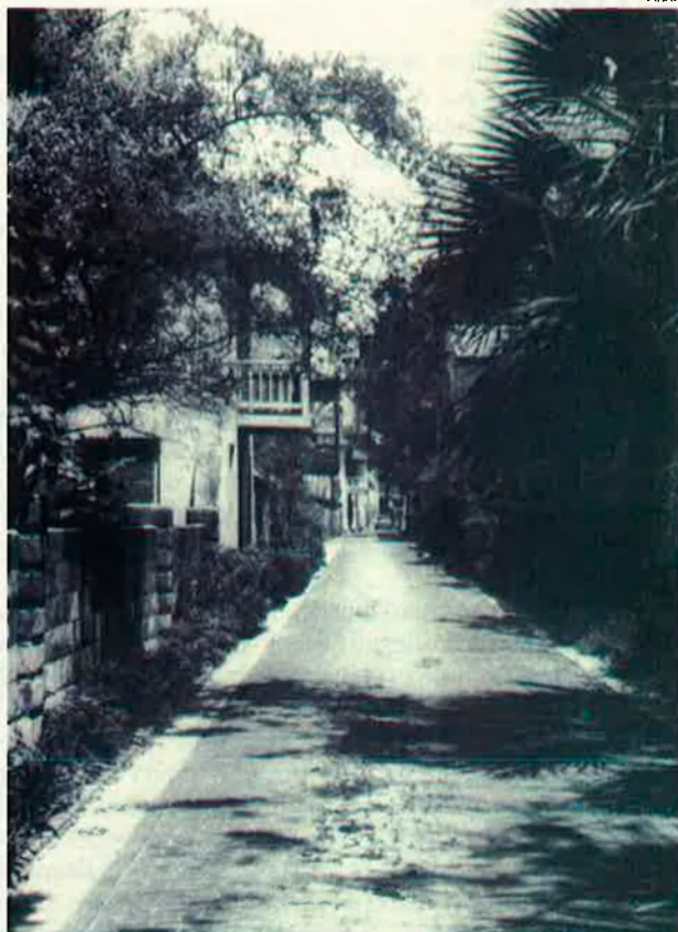
Imatge del carrer d'Avilés, a Sant Agustí. Els noms hispànics es repeteixen en la denominació de carrers.

Tot aquest conjunt de factors negatius degué desanimar els immigrants menorquins. Les constants revoltes colonials, les incursions de nadius que veien en