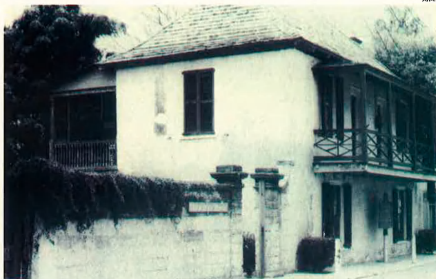
La casa dels Llambies. Els menorquins es van traslladar en massa a Sant Agustí, la capital militar i administrativa de la zona.

I és aquí on apareixen els menorquins, que no solament estaven habituats al clima i als conreus mediterranis, sinó que aleshores eren a més a més membres de l'Imperi Britànic. Per tant, no ens hem d'estranyar que el projecte "civilitzador" d'Andrew Turnbull comptés amb la participació d'un miler de menorquins (aproximadament el 71% de