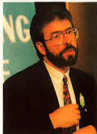
Gerry Adams, del Sinn Féin.

L'IRA, pel seu cantó, ha criticat l'actitud obstructionista de John Major per fer avançar el procés de pau, i ha fet una nova crida perquè els partits implicats en l'enfrontament es tornin a reunir per dialogar sobre una sortida pacífica al conflicte. Al mateix temps, però, l'IRA ha criticat tant l'actitud del primer ministre britànic com la del primer ministre irlandès, John Burton.