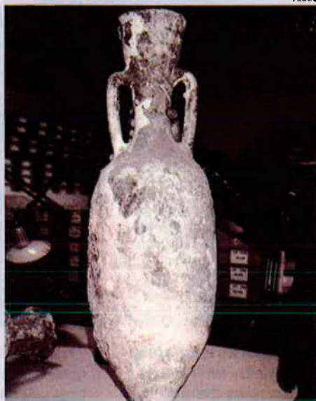
Material Intervingut pels Mossos d'Esquadra. En un domicili de Llançà.