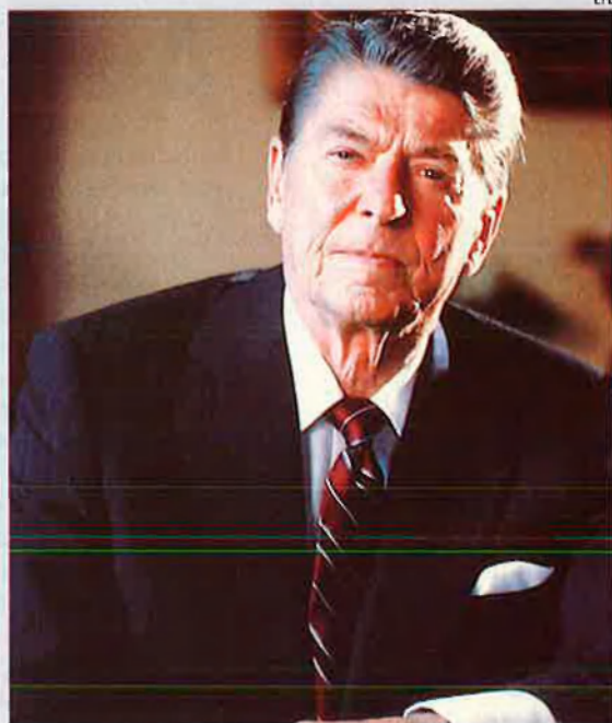
Les tesis de Reagan no cauen en l'oblit. El seu model d'estat és ara de nou reivindicat.

Cert que entre el Contracte per Amèrica del president de la Cambra de Representats, l'ultraconservador Gingrich, i els nous compromisos de Clinton encara hi ha una distància. Però el president, en un any d'eleccions presidencials i després del correctiu de contemplar la formació d'una aclaparadora majoria republicana en el Congrés, torna progressivament sobre les seves pròpies petjades. Ara parla molt més "d'enfortir la família americana", "alliberar els nostres carrers dels crims i les drogues amb més policia i més càstigs", "de mantenir el lideratge mundial dels Estats Units" i de promoure un estat diferent, que no podrà ser la resposta per a tots els proble-