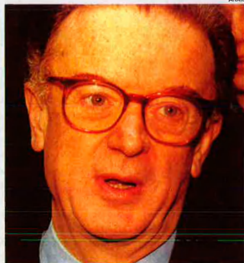
Jorge Sampaio. Vencedor de les eleccions presidencials a Portugal.

Soares se'n va per la porta gran, amb un currículum que impressiona fins i tot els qui col·leccionen màsters als Estats Units. Ha estat president de la república durant deu anys, cap de govern, ministre i destacat opositor a la dictadura de Salazar. Mentre Cavaco es feia home estudiant lleis, el socialista heterodox Soares vivia a l'exili de París, llegint els clàssics i alimentant l'esperança dels portuguesos dissidents i dels nacionalistes de les colònies africanes.