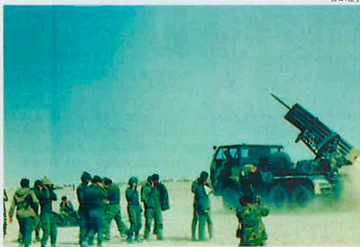
Les conseqüències de la guerra del Golf encara són un misteri. La censura militar ha contribuït a enfosquir la realitat.

La pàtina extra de patetisme que el temps confereix a algunes actituds humanes esdevé especialment significativa en aquest cas. A propòsit de la Guerra del Golf, Ignacio Ramonet escrivia, el març del 1991, a Le Monde Diplomatique . "Des del Vietnam, les guerres són secretes perquè els sistemes de poder han entès que allò que no es mostra no existeix; que allò que no surt a la televisió no té realitat". Doncs bé, l'Occident, des d'aquesta tesi i amb la col·laboració dels grans monstres comunicatius nord-americans, britànics i francesos, va aixecar un dels murs de silenci més alts, envoltat d'imatges asèptiques, mai construïts des de societats democràtiques. Una