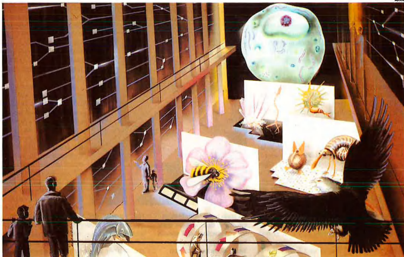
Simulació del que seria la sala temàtica multimèdia "Vida". Explicaria al visitant, valent-se d'audiovisuals i de locucions de banda sonora, la lògica i el funcionament de la biosfera i l'introduiria en els problemes de la gestió ambiental.