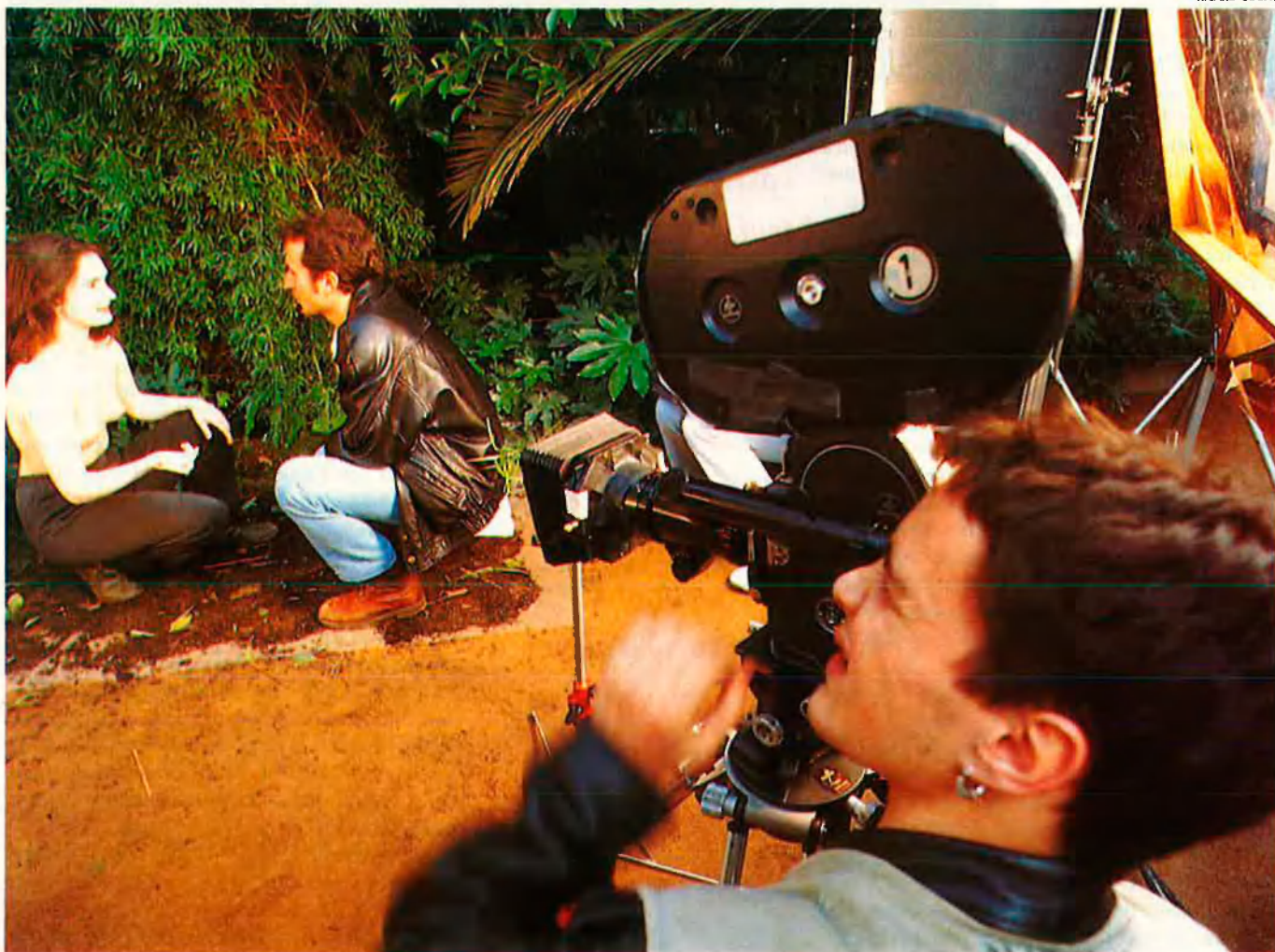
Estudiants de l'ESCAC roden una seqüència del curt-metratge 'Umbracle II'. La narració recupera les figures d'Adam i Eva al Paradís.