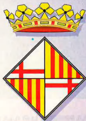
] Model optatiu [

De moment el disseny del nou escut de l'Ajuntament de Barcelona és una incògnita. La setmana passada van aparèixer diversos projectes, com el de la dreta, però encara no hi ha un disseny definitiu.