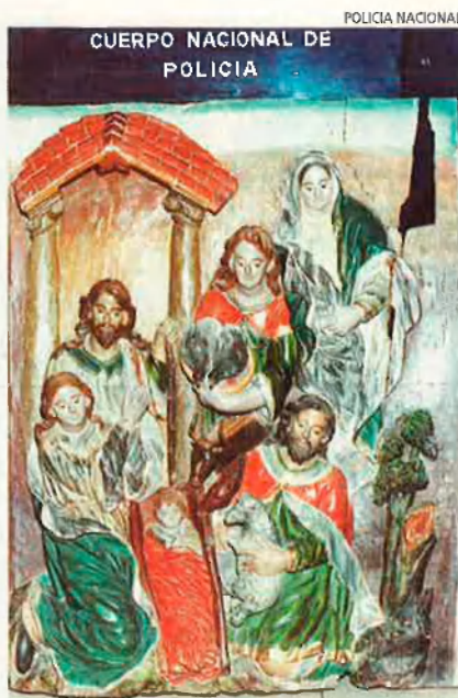
Peces procedents de robatoris a Castella. La Policia Nacional les va poder recuperar aquest estiu a Barcelona.

Espoliar a les Balears. Les institucions de Balears encarregades de la preservació del patrimoni són actualment els consells insulars (de Mallorca, Menorca i Eivissa-Formentera). Abans ho era la Conselleria de Cultura del Govern de la comunitat, que va cedir les competències de patrimoni als consells el mes de gener passat. Per conèixer més acuradament la riquesa arqueològica, la Conselleria va començar fa uns anys un laboriós projecte: cartografiar tots els jaciments, i bona part de les restes arqueològiques submergides a la mar. Així, els tècnics de cada con-