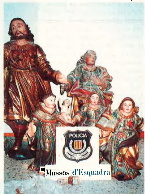
Talles de Santa Maria de Porqueres. Recuperades aquest estiu pels Mossos.