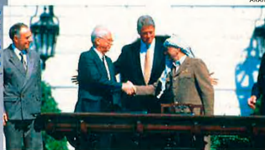
Rabin i Arafat. El 13 de setembre de 1993.

preveure és que el dia D la gent votarà en massa, malgrat les crides al boicot electoral que hi pugui haver. I és que la immensa majoria dels palestins frisa per anar a les urnes, per decidir alguna cosa sobre el seu futur, per oblidar, ni