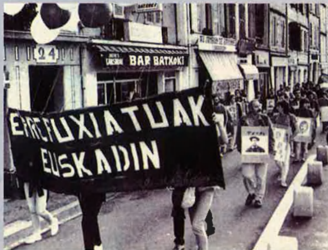
Manifestació en reivindicació del dret dels refugiats a viure en Iparralde. Un aspecte del conflicte basc.

Però, al marge de la veracitat i l'oportunitat de l'informe publicat pel diari ABC —en un moment en què sembla que el PNB propicia una via de diàleg amb els sectors més radicals del moviment nacionalista—, allò que resulta evident és que el mite del "santuari" etarra és cíclic dins els mitjans de comunicació. Hi apareix i en desapareix segons les conveniències. La denominació, que té un origen policíac, va començar a utilitzar-se a final dels anys 70, però quan es va popularitzar més, ves per on, va ser just abans de l'aparició del GAL. En aquell període se'n parlava sense parar. En els mitjans