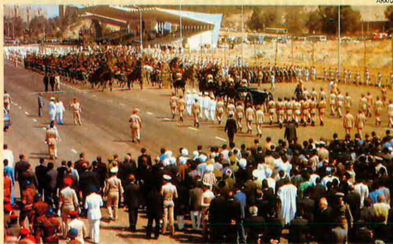
Soterrament d'Anwar el-Sadat. El faraó fou assassinat per "traïció".

"Sóc Jalid al-Islambuli, he matat el faraó i no temo la mort!". El magnicida només va dir aquestes paraules quan va ser detingut. Però la frase va ressonar per tot Egipte.