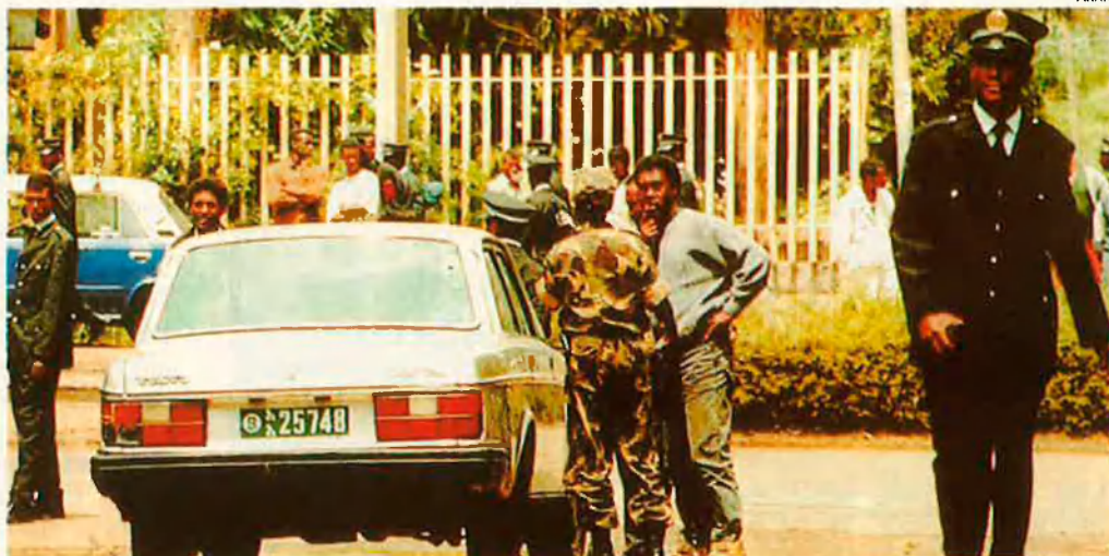
El cotxe usat pels integristes que intentaren assassinar Mubàrak. Fou a Etiòpia.

D imecres dia 29, just cinc anys després de les últimes eleccions legislatives, els egipcis tornaran a les urnes per renovar l'Assemblea del Poble, legislatiu unicameral de 454 escons.