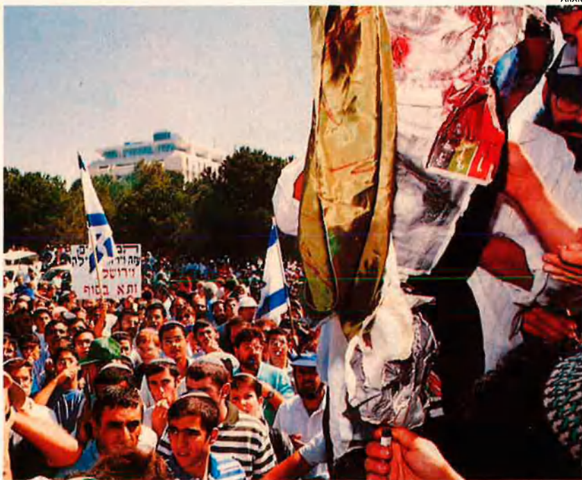
Manifestació dels radicals israelians. El Likud s'ha oposat des del principi a qualsevol acord amb els palestins per aconseguir la pau.