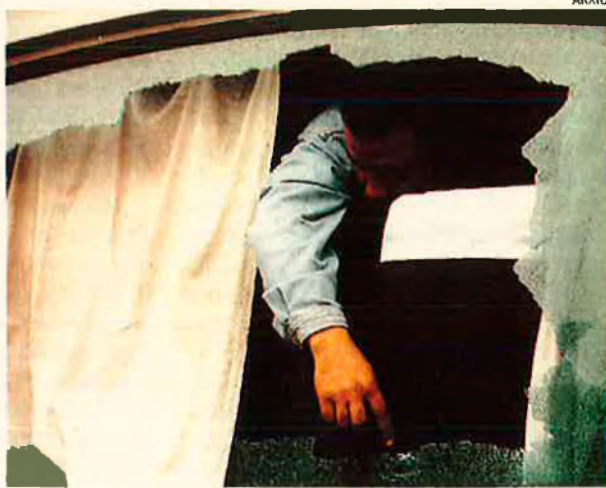
Atemptat a Egipte. La violència malmet l'islamisme.

Superar una etapa. Però cal assenyalar que una característica fonamental en les societats musulmanes és que el poder polític sempre s'ha apoderat dels dos aspectes: l'espiritual i el terrenal. La utilització de la religió com a arma política (cosa que, d'altra banda, ha ocorregut fins no fa gaire temps en el món occidental cristià) ha estat una constant fins avui dia. És el cas de les monarquies i de les repúbliques àrabs (el Marroc, Aràbia Saudita,