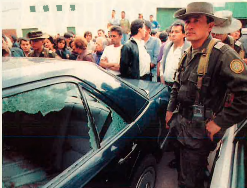
L'assassinat del dirigent del Partit Conservador Álvaro Gómez Hurtado ha sacsejat Colòmbia. Molta gent tem un cop d'estat militar.

L'escàndol sobre el finançament amb diner del càrtel de Cali va començar a adquirir proporcions faraòniques al juliol, amb la detenció