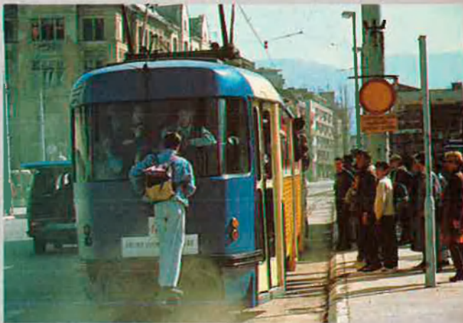
Sarajevo. Els ciutadans intenten recuperar la normalitat.

La possibilitat que els bombardejos es repreguin, que les bales dels francotiradors tornin a trencar vides humanes, els terroritza més que mai. Sobretot ara que, des de fa vint o trenta dies, amb els serveis de gas, electricitat i aigua restablerts parcialment, poden començar a recordar que, en efecte, aquesta va ser una ciutat com qualsevol altra d'Europa, tan andònima o tan especial com qualsevol. Mostren un escepticisme natural, aclaparador, sobre aquest 37è alto-el-foc. Temen que acabi com els precedents, és a dir, com el preludi d'una renovada agressió. Però molt interiorment, gairebé amb els ulls tancats i els dits creuats, confien secretament que aquesta pau precària s'instal·li definitivament