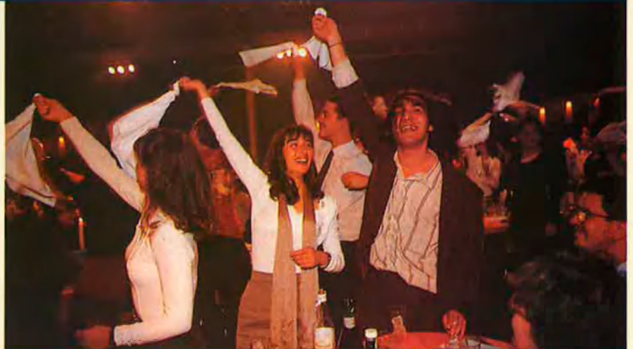
El sector juvenil del sopar va imposar un ritme frenètic. La televisió va agrair una claca tan entusiasta i animosa.