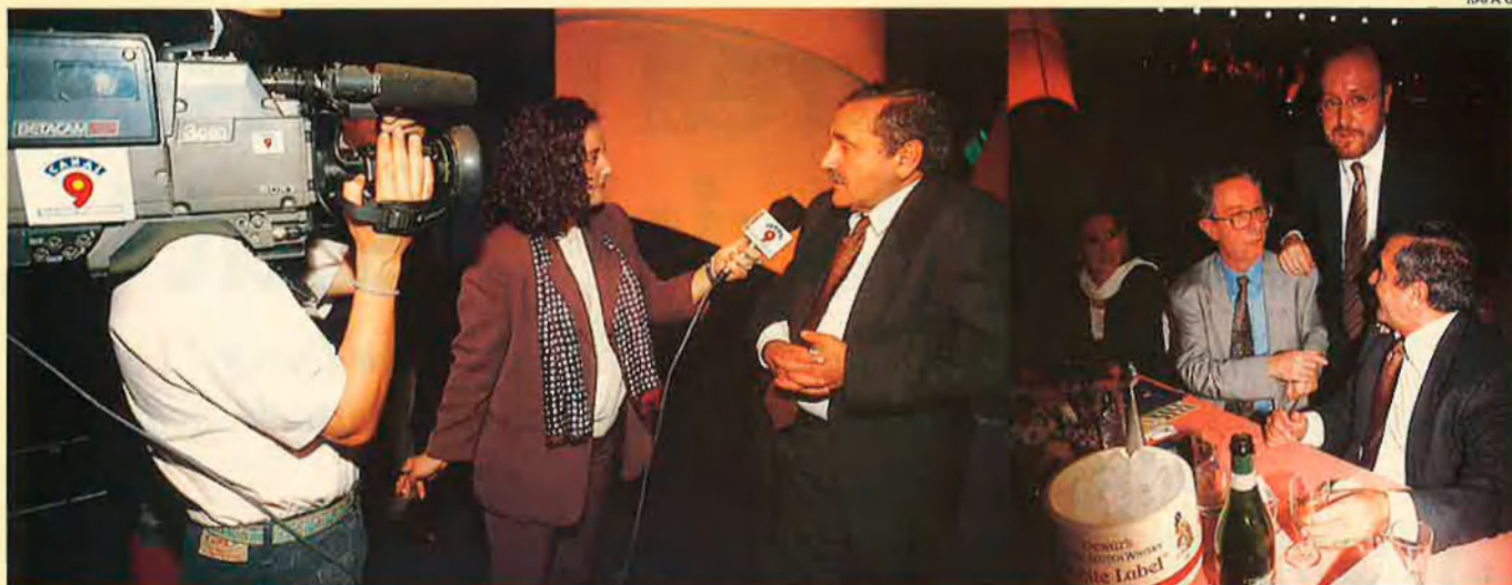
L'organitzador dels Octubre, entrevistat per Canal 9. La nova direcció de Televisió Valencana decidirà ara on i quan apareix l'entrevista.