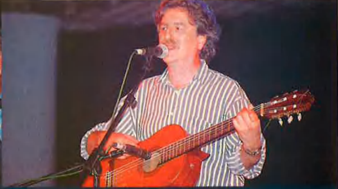
Al Tall va electritzar el públic. L'actualitat política ha tornat encara més vives les seues lletres.