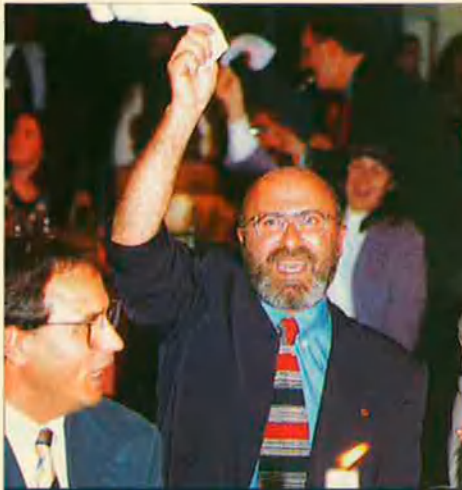
Albert Taberner. El secretari general d'EU s'encomanà de l'emoció juvenil.