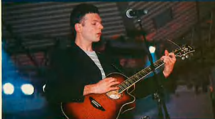
Umpah-pah va mobilitzar els tovallons de gairebé totes les taules. Hi tenia res a veure Huerga?