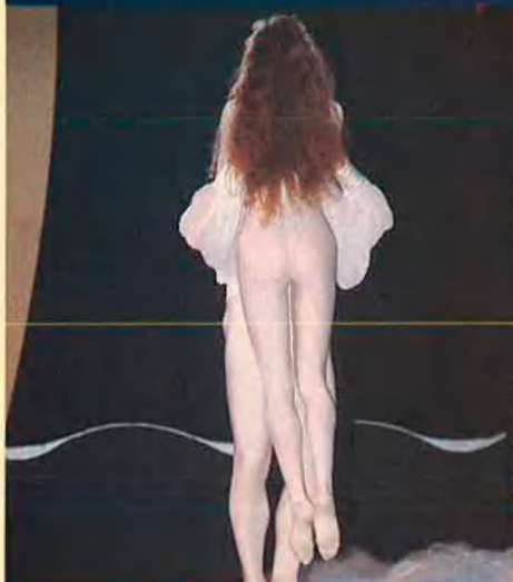
Ballet del Tirant. La vaporositat de l'actuació era, bàsicament, televisiva.