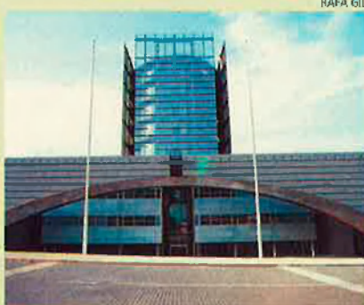
Canal 9. El PP en vol la privatització.

Anar amb presses. Eplicsa és també la propietària de Taurus, la coneguda marca de petits electrodomèstics amb plantes a Organyà i Oliana. Se'n va fer càrrec fa dos anys, després de la suspensió de pagaments de l'empresa i la reducció a la meitat dels llocs de treball. Es tractava