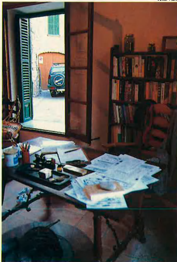
Recreació de l'estudi del poeta. En una exposició d'aquest estiu passat a Deià.

gèniament bells en aquells temps llunyans, els déus l'havien protegit i no havien permès la destrossa ni del territori ni de la fesomia urbana del poble.