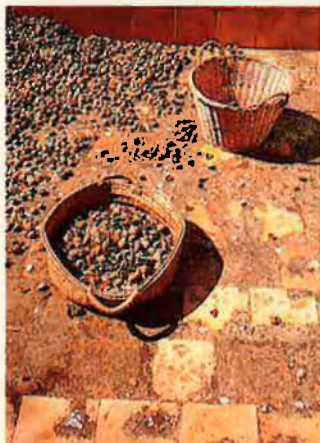
Recollint les ametlles. Per a endolcir l'hivern.