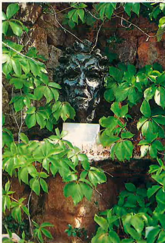
Bust de Robert Graves. Al jardí de "Canellun", sa casa.