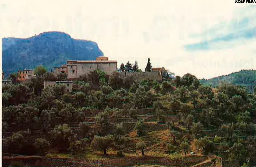
L'església i "el petit cementeri pacífic" de Deià. Mirant la mar.

Amb aquesta visita al cementeri de Deià, si-