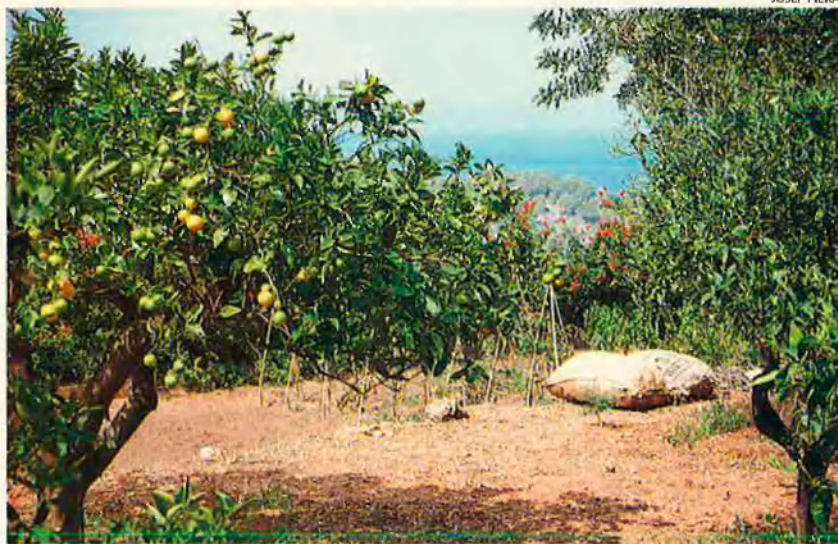
L'hort enjardinat de "Canellun". La casa dels Graves.