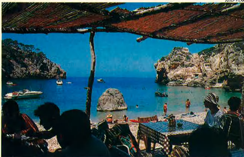
La cala de Deià: "Un semicercle de platja d'arena en un amfiteatre rocós."

té amb dignitat, i móres, pomes, roques, pins i ovelles, encara s'hi poden contemplar, com s'hi poden apreciar, sobre tot de camí cap a Deià, magnífics olivars d'un cuirassat classicisme, nobles i antics, d'una ancianitat tan dignament venerable com la del millor temple grec.