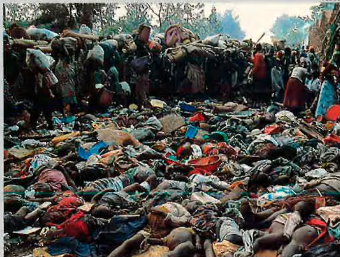
La tragèdia de Somàlia. El paradigma de la barbàrie.

Aquesta estratègia de l'"equilibri sostingut de l'horror" es va enfonsar estrepitosament amb la desaparició de la Unió Soviètica i la dissolució del Pacte de Varsòvia. I així com es van desencallar conflictes enquistats per culpa en part de l'existència mateixa dels blocs (Nicaragua, El Salvador, Pròxim Orient, etc.), han aparegut d'altres, la gossadia i l'extrema violència dels quals –amb l'anihilació