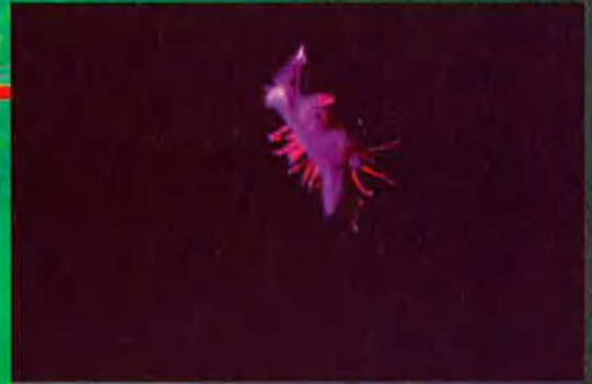
Llebre de mar ('Flabellina affinis'). Viu a la Mediterrània. N'existeixen dues variants, la negra i la bruna.