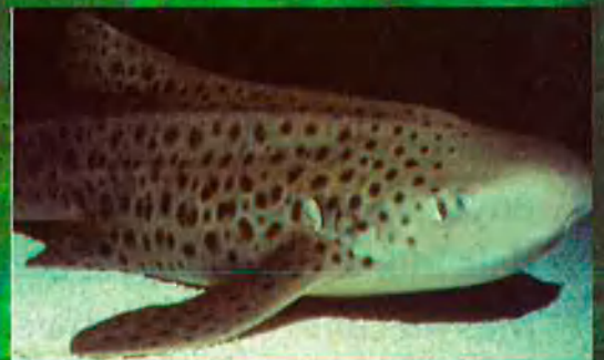
Solraig de sorra. Viu a la Mediterrània. A l'Aquàrium el poden veure a l'Oceanari.