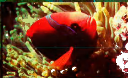
Peix pallaso ('Amphiprion bicinctus'). Habita els tròpics. A l'Aquàrium hi ha una reproducció d'un atol tropical.