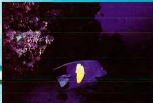
Àngel. Habitant de les aigües càlides del Mar Roig.