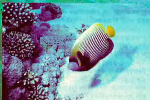
Peix emperador ('Pocamanthus imperator'). Aquest espècimen habita els fons el Mar Roig.