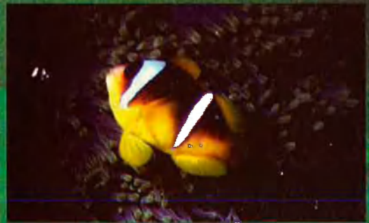
Peix pallaso amb anemone ('Amphiprion bicinctus'). Habita les aigües tropicals.