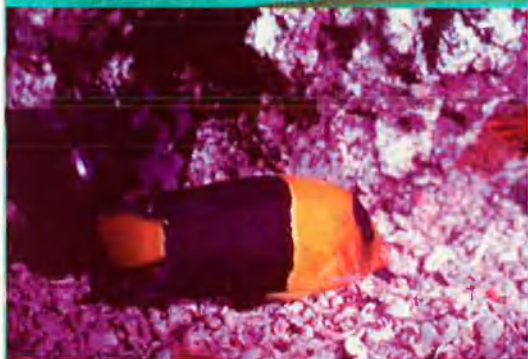
Peix àngel bicolor ('Pocamanthus'). Viu al mar Roig, el mar tropical més pròxim a la Mediterrània.