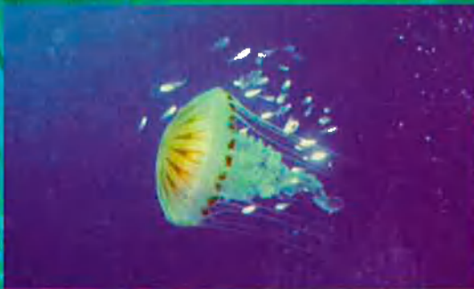
Medusa ('Chrysaora hysoscella'). Viu a la Mediterrània. La seva picada pot resultar perillosa.