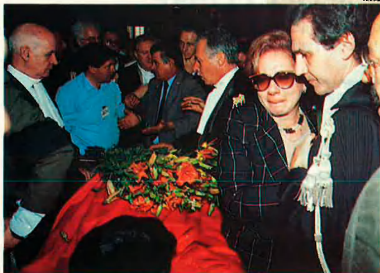
Soterrament del jutge Falcone i la seva esposa. Una mort anunciada.

A un apartament de Palerm, Salvatore "Totò" Riina brinda amb els altres capi per l'èxit de la carniseria. No s'accontenta amb spumante , i demana xampany francès. V. L.