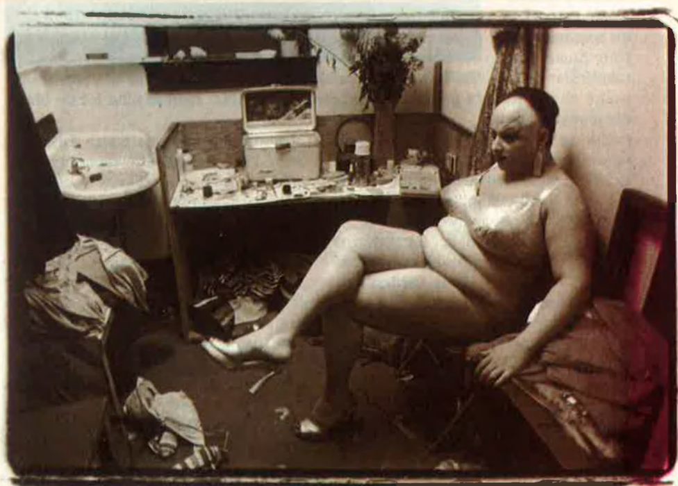
'Rolling Stone' va donar suport a les figures de l'underground com Divine.

Les morts de Jimi Hendrix, Janis Joplin i Jim Morrison i els concerts de Woodstock i Altamont escandalitzaven la premsa nord-americana tradicional, Rolling Stone , però, convertia aquests esdeveni-