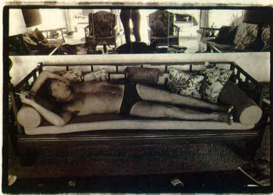
Jann S. Wenner, amb 21 anys, fundava la revista que havia de ser la veu publicada dels joves. En la imatge, una fotografia de 1975.

Quasi trenta anys després de la seua creació, 'Rolling Stone' continua mantenint la seua poderosa influència dins del panorama cultural nord-americà. Orientada originalment cap al món del rock, la revista va obrir els seus horitzons amb la publicació de polèmics i originals reportatges sobre temes socials, polítics i culturals signats per joves desconeguts que posteriorment es convertirien en les figures del 'nou periodisme'.