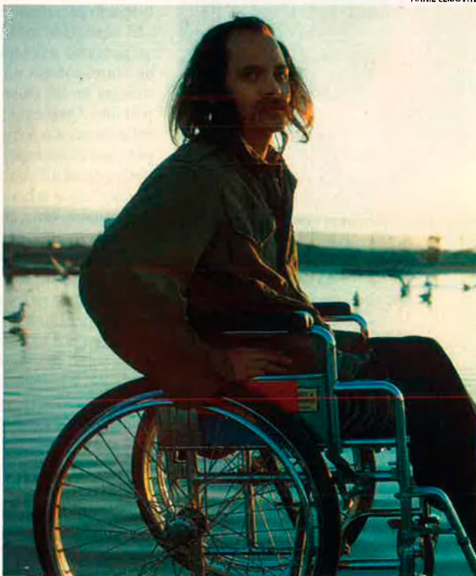
'Rolling Stone' publicà un reportatge sobre el veterà de la guerra de Vietnam, Ron Kovic. Avui se n'ha fet un film.

La sospitosa mort de Karen Silkwood l'any 1974 fou un altre reportatge que també tingué una adaptació cinematogràfica posterior. Karen Silkwood era una tècnica de laboratori que va morir en estranyes circumstàncies quan estava a punt de denunciar a la premsa greus anomalies en el funcionament de la fàbrica de plutoni on treballava. El cas Silkwood va causar un gran escàndol als Estats Units perquè es va demostrar la conducta criminal d'alguns dels responsables de la indústria nuclear. El reportatge de Rolling Stone va servir per a obrir un debat públic sobre els riscos de l'energia nuclear i les condicions futures del seu desenvolupament.