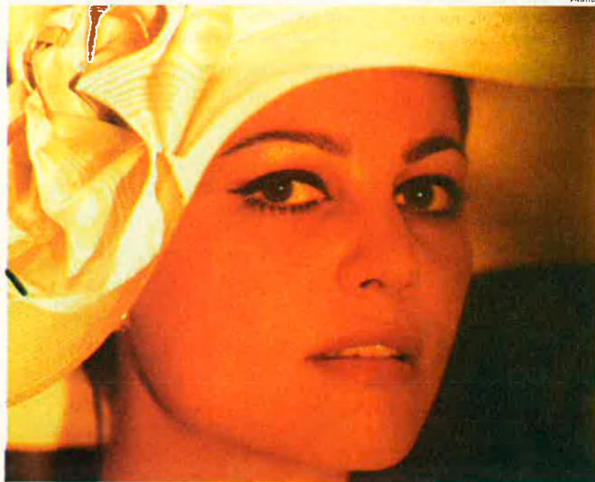
Claudia Cardinale va venir a Barcelona. El motiu va ser el rodatge de la pel·lícula 'El fabuloso mundo del circo'.

El següent terratrèmol que ens envià Hollywood va ser el rodatge d' El Cid , una producció de Samuel Bronston dirigida per Anthony Mann que va rodar-se en part a Castella i en part a terres valencianes. Charlton Heston, ex-Ben Hur, arribava a Madrid l'agost del 1960 i era assetjat per la premsa amb preguntes sobre el cinema espanyol i sobre la figura històrica del Cid. Un allixonat però també un bon tros despistat Heston contestava amb un discurs històric "El Cid es per Espana el que el rei Artur és per Anglaterra. Tot i que El Cid és història i el rei Artur només llegenda". La incògnita de qui faria el paper de Doña Jimena no es va desvelar fins ben bé el mes d'octubre. Finalment, l'escollida va ser Sophia Loren, que venia de l'èxit del seu primer paper dramàtic a Dos mujeres . Sophia arribà via Madrid el mes d'octubre. La pel·lícula va immortalitzar la platja de Peníscola en la llegendaria batalla que el Cid guanya un cop mort.