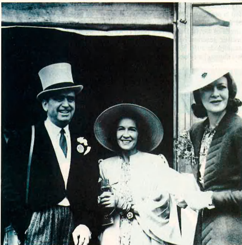
Douglas Fairbanks, amb la seva tercera esposa Lady Sylvia Hawkes. El matrimoni vindria a la ciutat de València.