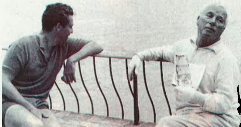
Charles Chaplin durant un estiu a Cap Ferrat. El genial actor i director també es va allotjar al famós Hotel Formentor, a l'illa de Mallorca.

Rodatges insòlits. Tot i que Itàlia va guanyar-nos la partida a l'hora de convertir-se en plató natural de Hollywood a Europa, el nostre país ofería la possibilitat de treballar en paisatges que igualment podien ser exòtics, suggerents i no gaire cars. (Gràcies a les disposicions del fisc dels EUA, els beneficis aconseguits fora del país en el primer any i mig d'estada fora, no pagaven impostos.) A banda dels rodatges de les grans produccions i dels grans títols, Hollywood va produir un seguit de films —moltes vegades coproduccions— que per circumstàncies diverses van acabar sent productes de poc culte o simplement prescindibles. Aquest és el cas del rodatge al Montseny de Penny Princess amb Dirk Bogarde i Yolande Doulan i direcció de Val Guest el novembre de 1951 o Erase una vez , film d'època amb Joan Fontaine i Louis Jourdan rodat a Sitges i dirigit per Hugo Fregonese el maig de 1952. Altres títols de la dècada dels seixanta i setanta van ser Los pianos mecánicos , amb Melina Mercouri i James Mason, dirigida per Bardem i rodada a Cadaqués, El misterio de las naranjas azu-