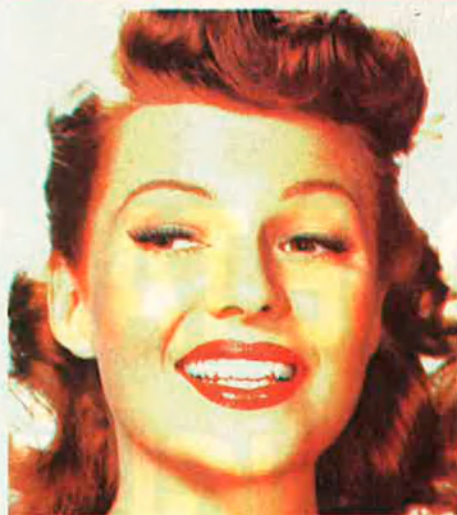
John Wayne i Rita Hayworth. També aquesta parella d'actors participaren en la superproducció 'El fabuloso mundo del circo', rodada a Barcelona.