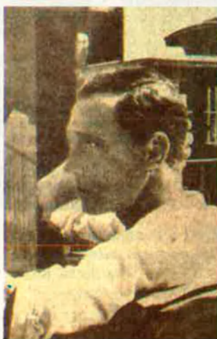
Dalt, el Rolls de Buster Keaton als arrossars entre Sueca i Sollana on, segons deien les cròniques, l'actor va somriure. A la dreta, Keaton en la gasolinera de Massamagrell.

rant setmanes la Costa Brava va viure comoguda per les anades i vingudes de Liz, vídua de Michael Todd, amb el seu nou marit, Eddie Fisher. L'escàndol empaitava la parella, ja que Liz havia "robat" el marit a la que era la seva millor amiga, Debbie Reynolds. Els safareigs a banda, Liz Taylor va fer servir la Costa Brava per brodar una de les seves millors interpretacions tot alhora que aconseguia tornar a fer lluir una gran estrella anomenada Montgomery Clift que ja havia sofert el tràgic accident que marcà terrible-