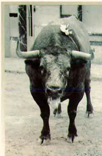
9. El bou s'esgota amb la lluita. El combat ja és injust.