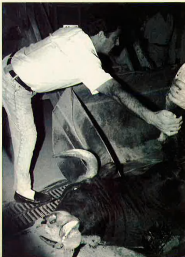
16. A voltes el bou és retirat amb una pala excavadora.

Teseu el roda amb bermudes i sabatilles d'esport. El Minotaure babeja escuma i aquest és el senyal que alguns esperaven.