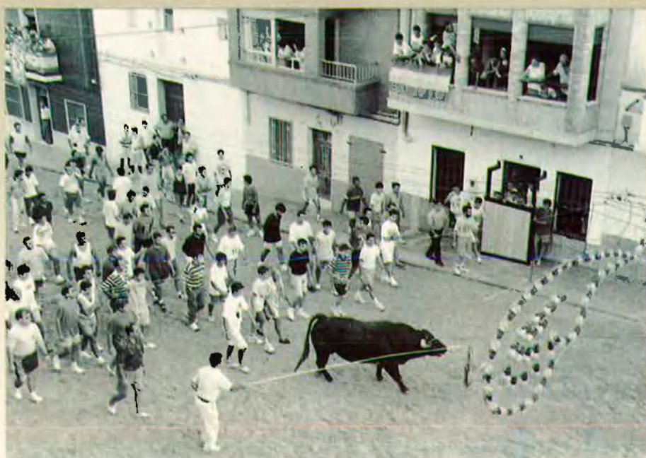
10. Comença el calvari. Les estacions són una gradació de dolors.