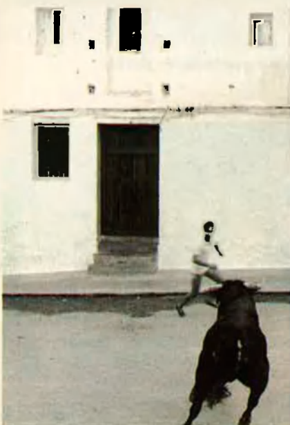
7. Façana blanca, vella de negre, Teseu i el Minotaure. Creta.