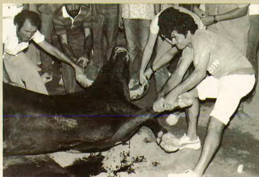
17. En alguns casos es procedeix a la dissecció en el mateix punt on ha caigut mort.