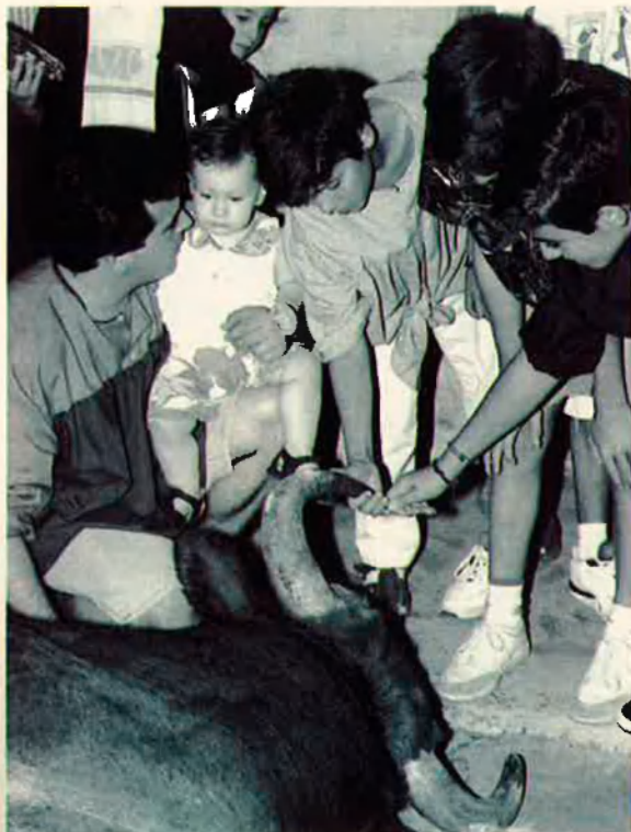
15. Els xiquets mamen l'espectacle amb normalitat.