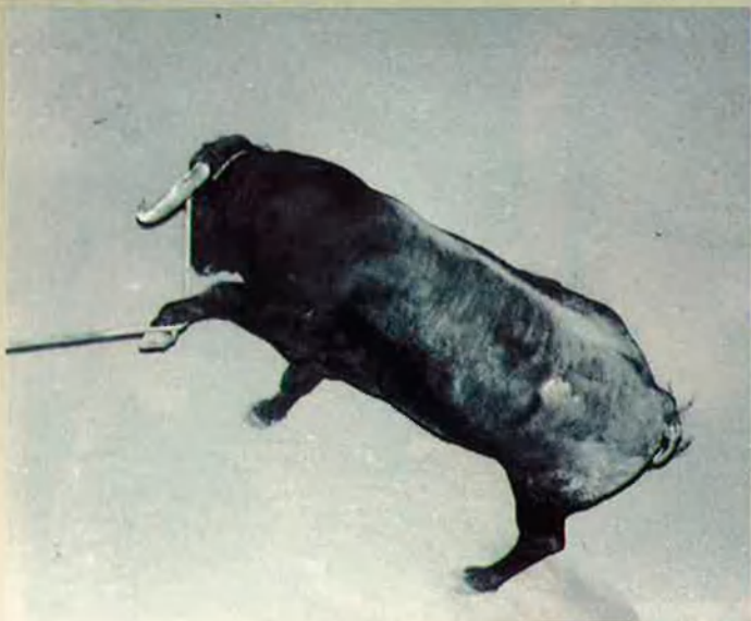
11. El bou ha exhaurit les defenses i ofereix una resistència més instintiva que eficaç.