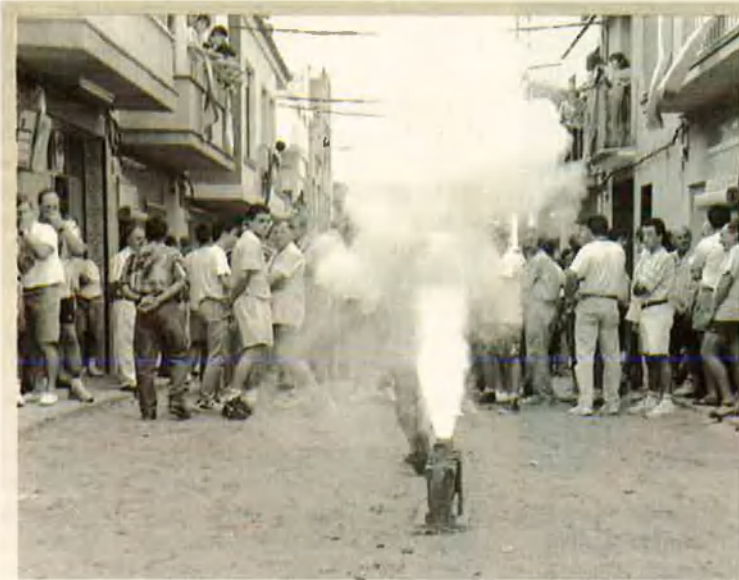
1. El tercer tronador indica l'inici de l'espectacle.