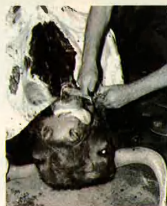
21. El matador repela amb ofici.