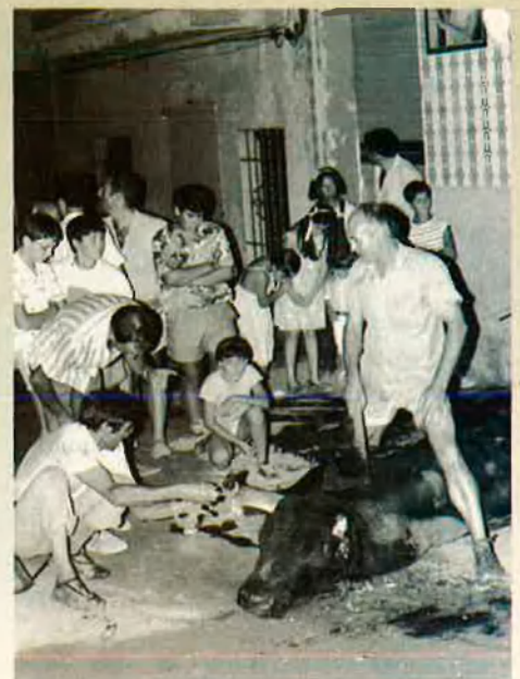
18. Les banyes es trenquen a colp de destreal.