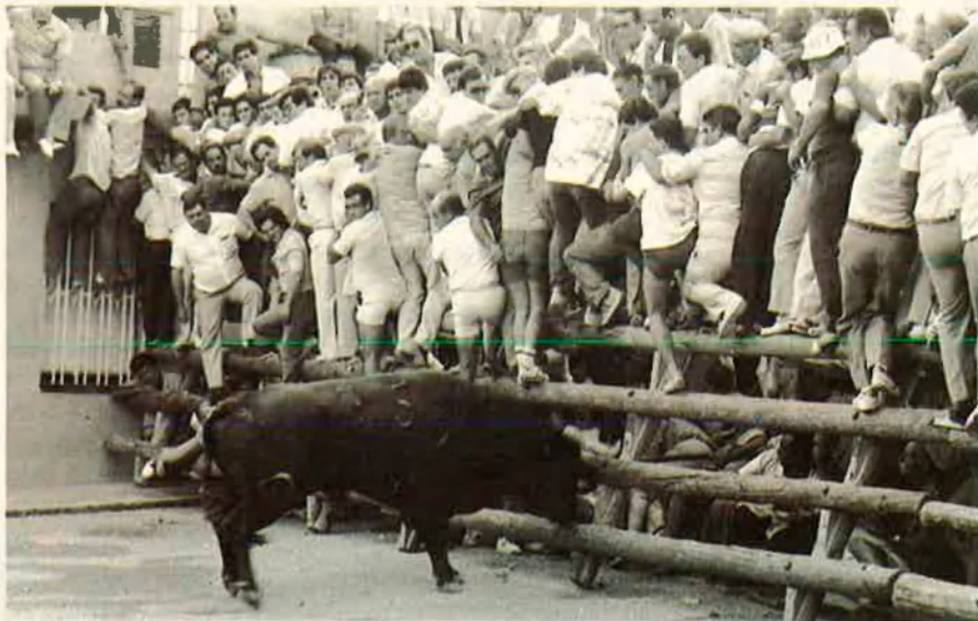
5. El bou contesta les provocacions que li fan des de la barrera.