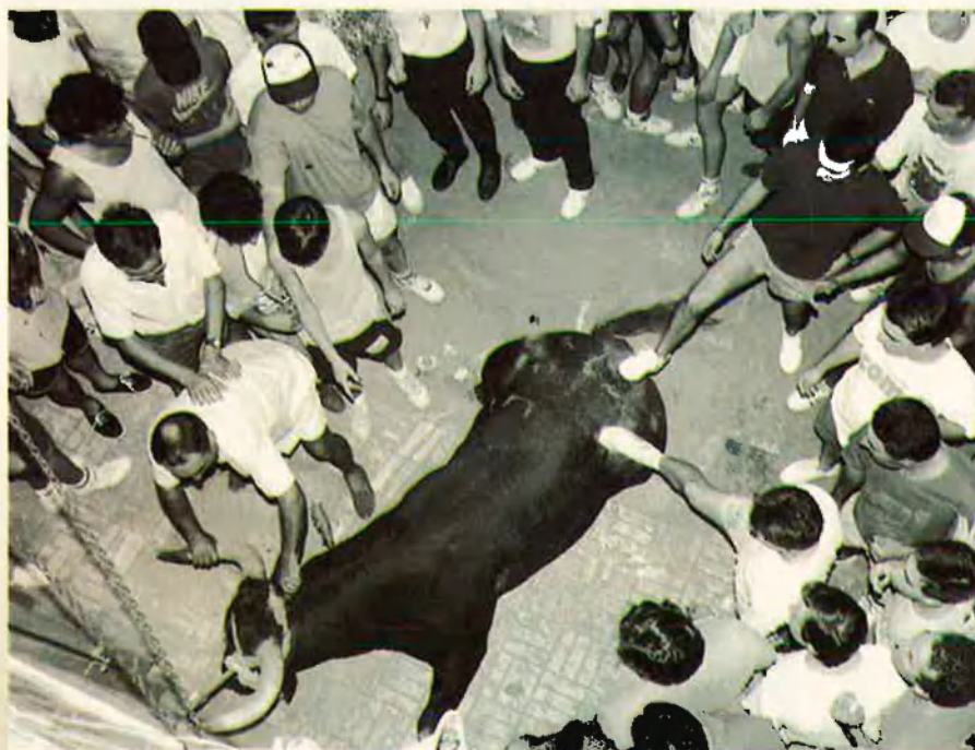
13. El bou és fixat contra la paret i el botxí el remata d'una punxada freda.