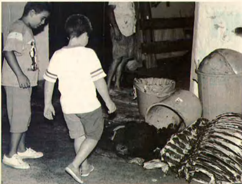
24. L'artista ha extret l'escultura de l'interior de la víctima.