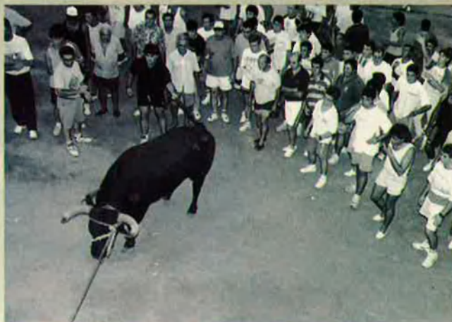
12. La corda condueix la víctima cap al punt fatídic.