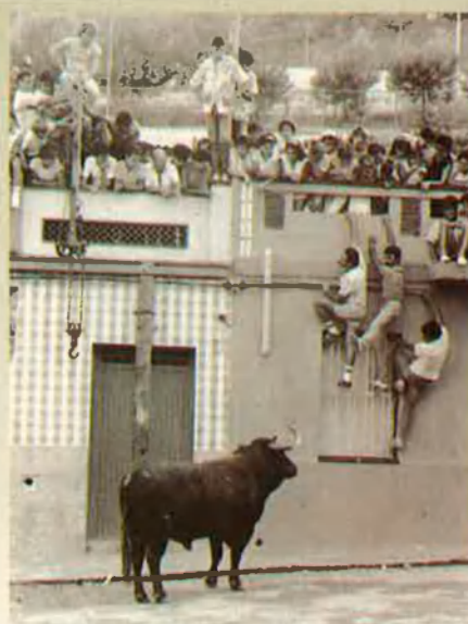
4. El bou posa a prova l'instint de conservació humana.