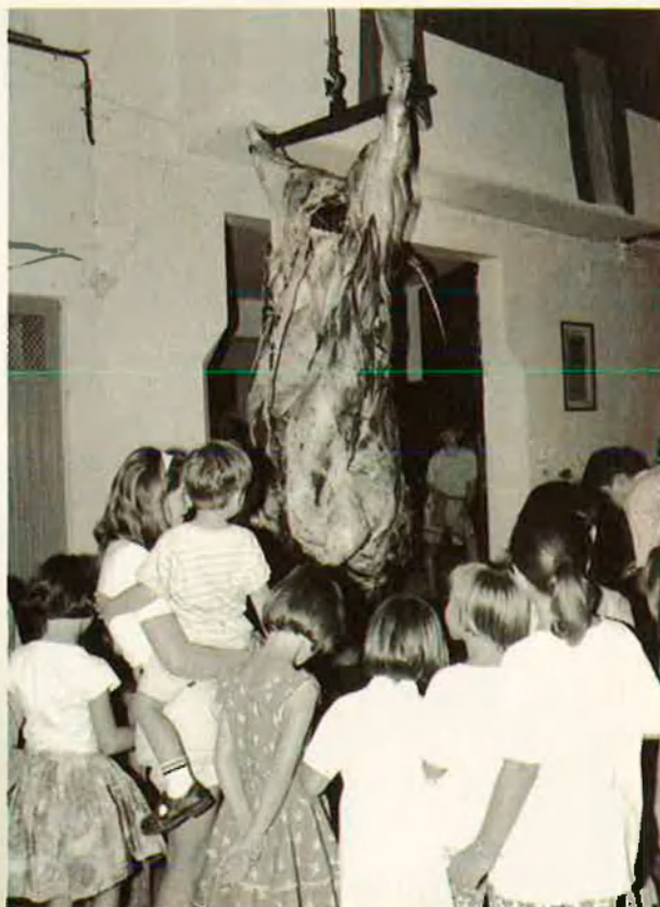
22. Un Rembrandt calent.