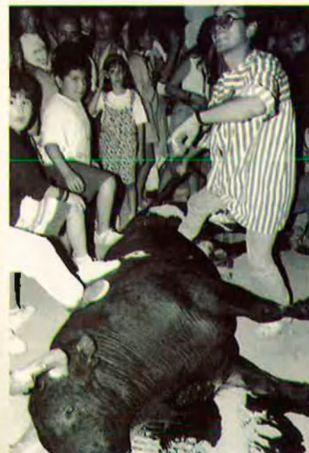
14. Un heroi bomba la sang amb el peu.

Amb noms com Sargento o Novelero, que alimenten tragèdies, animen interjeccions o provoquen badalls molt sonors. L'home i el bou entaulen un combat a base d'enganyos. D'astúcia. D'igual a igual. Al tercer estrèpit de carcassa irromp un bou de mil centrí-