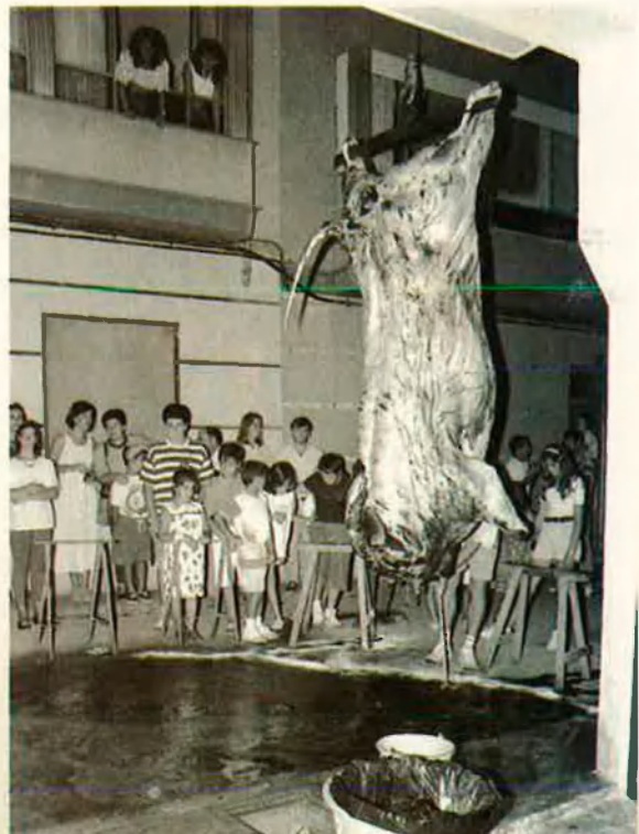
23. Més Rembrandt, sobre una bassa de sang molt estimulant.

sang qualle en l'interior. Es neteja la fulla del ganivet en el camal i es passa la llengua sobre el llavi superior. Un optimista servicial destapa una claveguera i un jove, que en molts casos ha demostrat gran sensibilitat tocant el clarinet en les processons, bomba amb