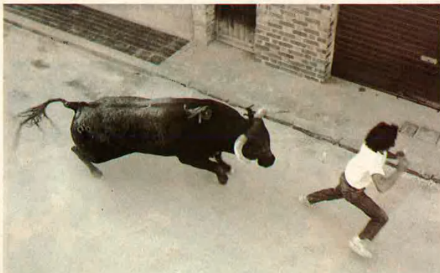
8. El més insignificant error del rodador és aprofitat pel bou.