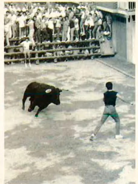
6. Rodar un bou té la seua coreografia.