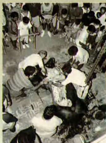
20. La classe d'anatomia continua.