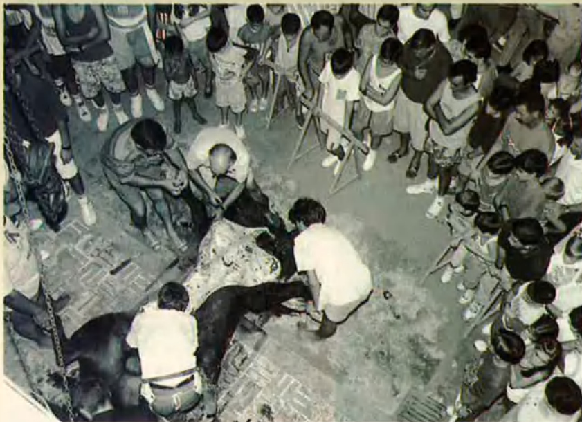
19. El bou es pelat davant una interessada afluència. Les mosques s'exciten.