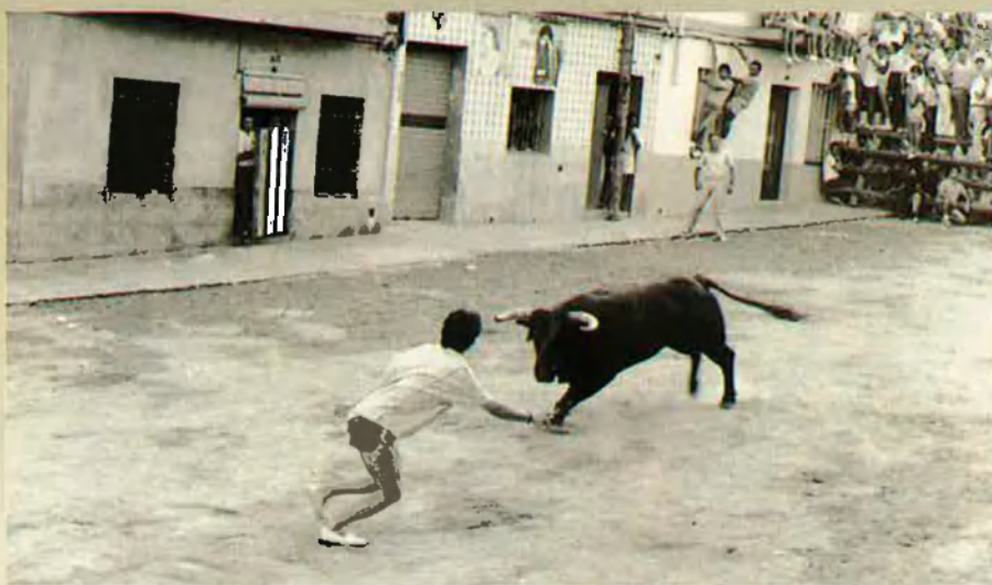
3. El rodador fa una exhibició d'astúcia, valentia i sentit del risc.