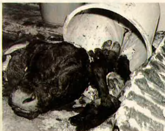
25. La festa es concentra en aquesta naturalesa morta. La resta es menja en estofat.

ventren davant uns xiquets que demostren tant d'interès per la lliçó d'anatomia com les mosques. Amb pols certer secciona els membres i el bou queda obert en canal i penjat a la intempèrie, en un refinat homenatge a Rembrandt que no desaprofiten les