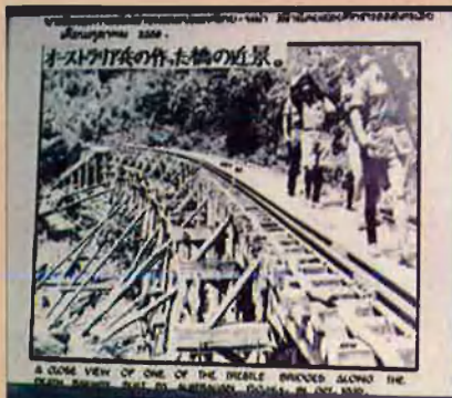
Presoners australians recorren la línia fèrria.