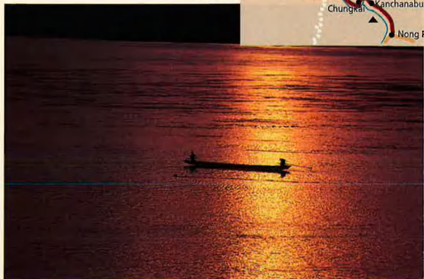
Després de la guerra, les tombes jalonaven el recorregut. Les restes foren traslladades als cementiris de Chong Kai, a la vora del riu Kwai.

El pont va ser bombardejat per la RAF i la USAAF en diferents accions de 1944 i 1945 que li van produir ben importants danys. En aquests i altres atacs al ferrocarril van morir molts presoners, ja que els camps ubicats al