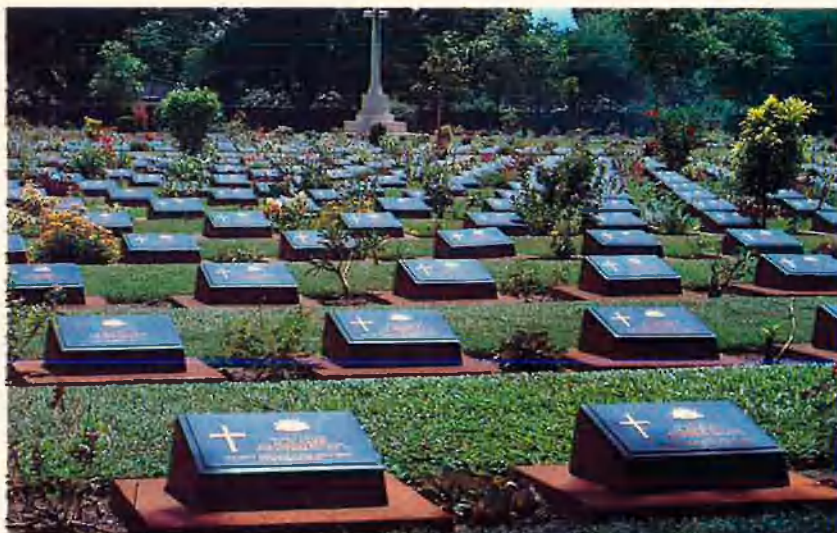
La cura que es dispensa als cementiris és exquisida. No evita, però, la impressió que causen les milers de plaques dels oficials i soldats morts.