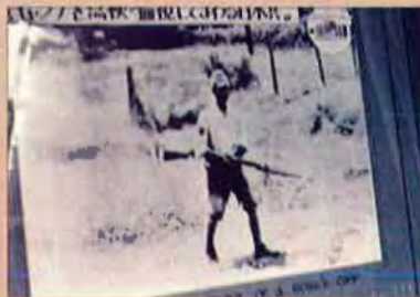
Soldat japonès fent guàrdia enfront d'un dels camps de presoners.