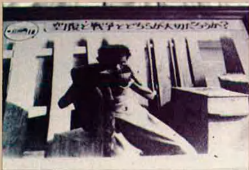
Imatge d'un 'coolí' (treballador indígena) durant un descans del treball.

K anchanaburi és una ciutat petita a 130 quilòmetres a l'oest de Bangkok. Com cada any, el 25 de novembre s'hi celebra la destrucció, durant la Segona Guerra Mundial, del pont que, símbol del Ferrocarril de la Mort, travessa el riu Kwai.