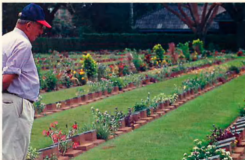
El visitant arriba a tenir consciència de la significació històrica del fet. La contemplació de les tombes convida a la reflexió.

Molts dels oficials de l'exèrcit imperial japonès van ser condemnats i executats pels crims comesos contra presoners de guerra. Un monòlit que ha estat construït pels japonesos en memòria dels caiguts en la construcció del ferrocarril els honra i són molts