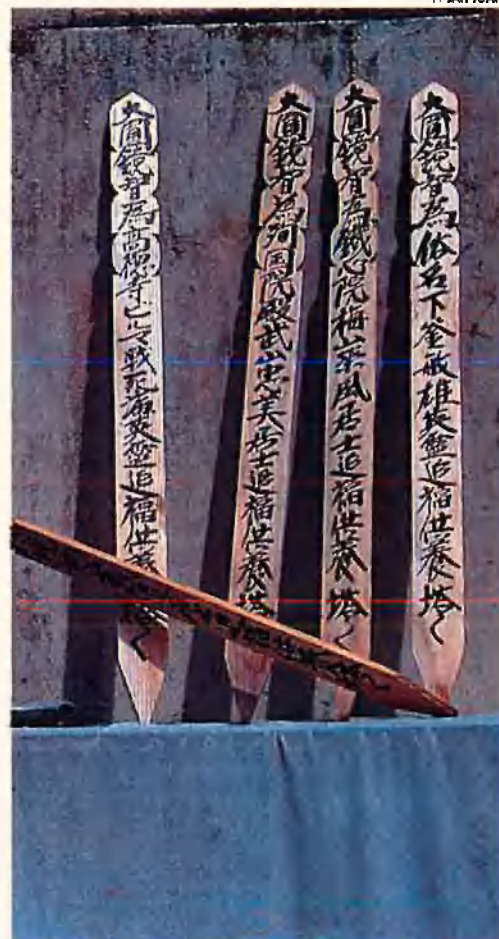
Les ofrenes han esdevingut un símbol de la memòria. En honor als caiguts.