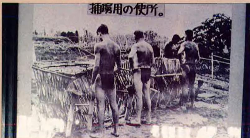
Un grup de presoners fa ús de les latrines del camp.