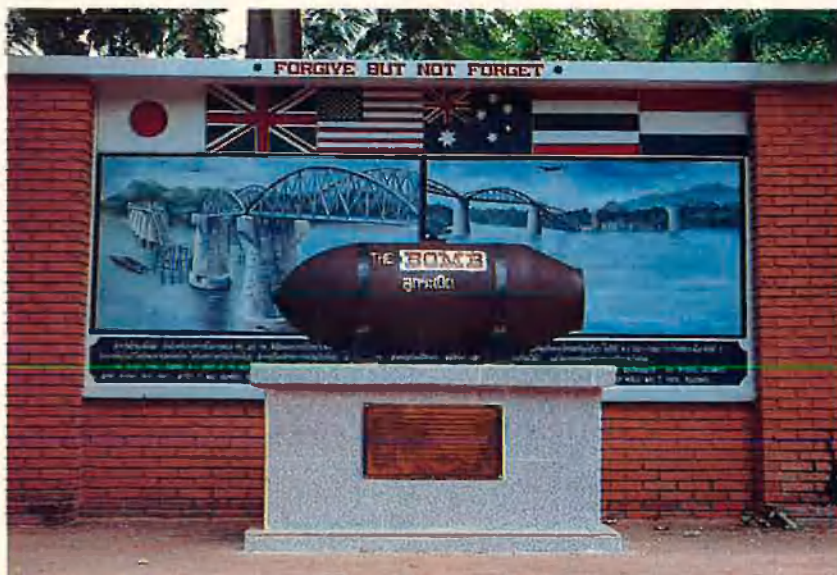
Monument. Una bomba sense explotar.

costat de posicions estratègiques no estaven identificats pels japonesos com era preceptiu. Les accions de terra, com la que apareix en la pel·lícula de David Lean són pura ficció; durant la guerra els grups especials de l'exèrcit aliat no pertorbaren mai l'important transport de tropes i el proveïment que va significar per als japonesos la construcció de l'estratègic ferrocarril.