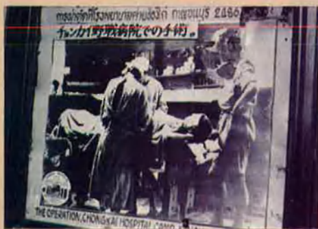
Sala d'operacions a l'hospital del camp de Chong Khai, a Kanchanaburi.