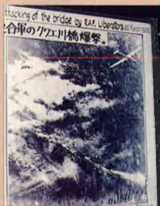
Fotografia aèria presa per la RAF durant un atac al pont sobre el riu Kwai.