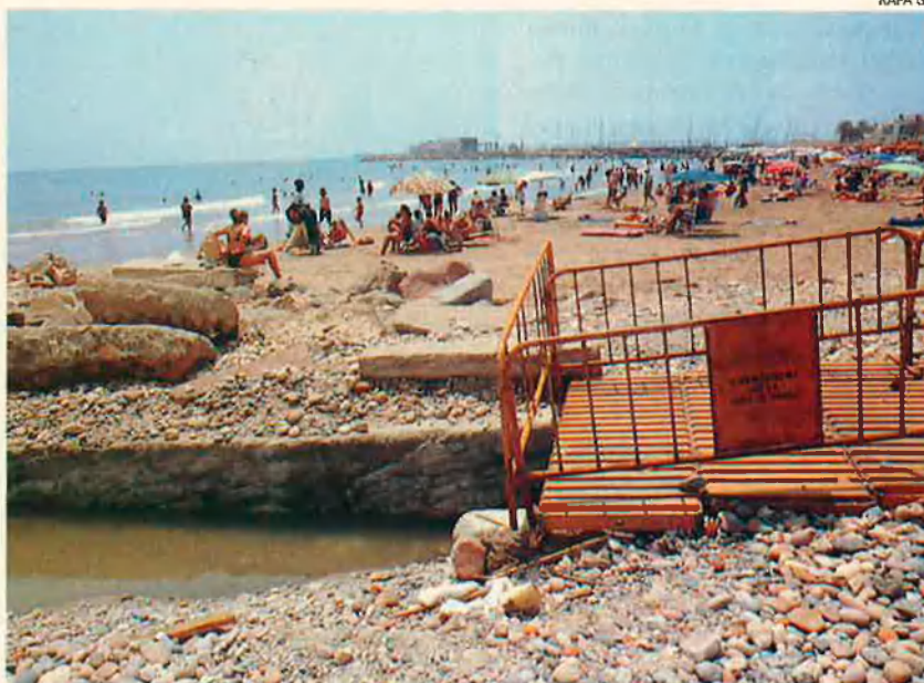
Platja de Pobla de Farnals. Els banyistes omplen la sorra malgrat que reconeixen que, ben a prop, s'hi aboquen aigües residuals.