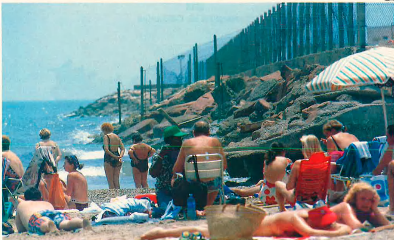
La platja de Poble de Farnals, plena de gom a gom un dimecres qualsevol al migdia. Cap senyal no indica que la platja no compleix les directives de la CEE.