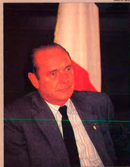
Jacques Chirac. El president francès ha recuperat la polèmica sobre les armes atòmiques.