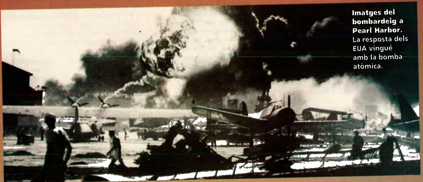
Imatges del bombardeig a Pearl Harbor. La resposta dels EUA vingué amb la bomba atòmica.