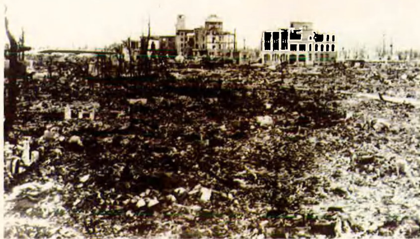
La ciutat d'Hiroshima després de l'esclat de la bomba. La destrucció.

també en això molt diferent. La inseguretat s'ha instal·lat finalment en una societat construïda sobre el respecte i la confiança en el grup per damunt de l'individu. Quan, a més, s'ha sabut que l'organització sectària de la Veritat Suprema, sospitosa d'haver realitzat aquests atacs terroristes, podria tenir informació clau per a construir una bomba nuclear, Hiroshima i Nagasaki han estat evocades de bell nou com un exemple per a la memòria de la humanitat.