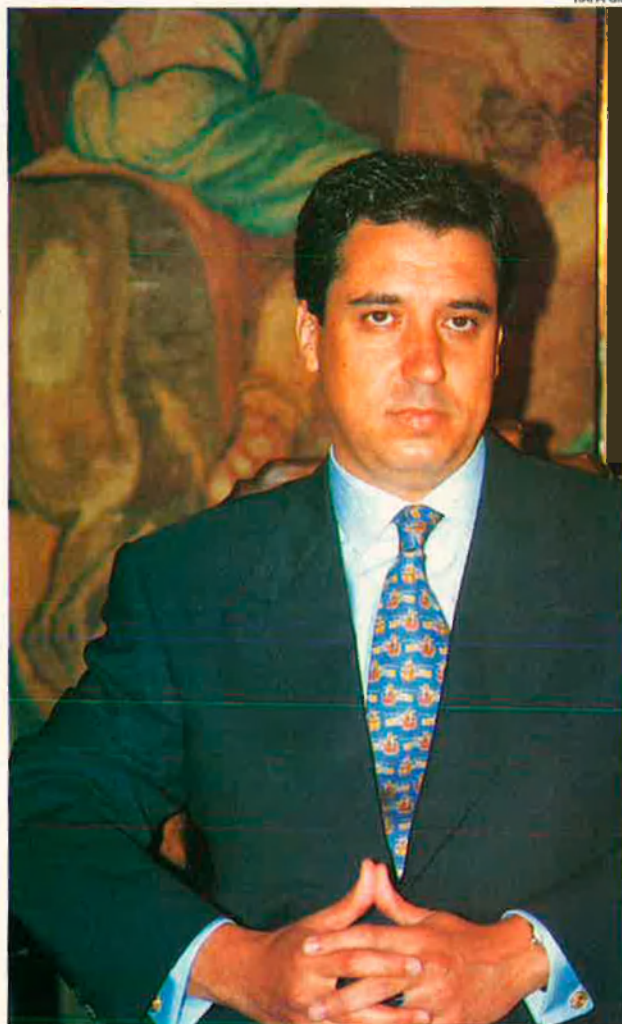
L'equip de govern d'Eduardo Zaplana modifica el programa electoral. La redacció s'adapta a la realitat.