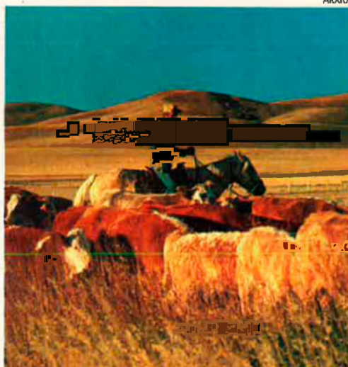
Fer habitable Texas.

"Això em fa pensar que, si no vaig errat, cap llibre d'Alvin Toffer -llegit per milions d'empresaris a tot el món- no ha estat traduït al català."