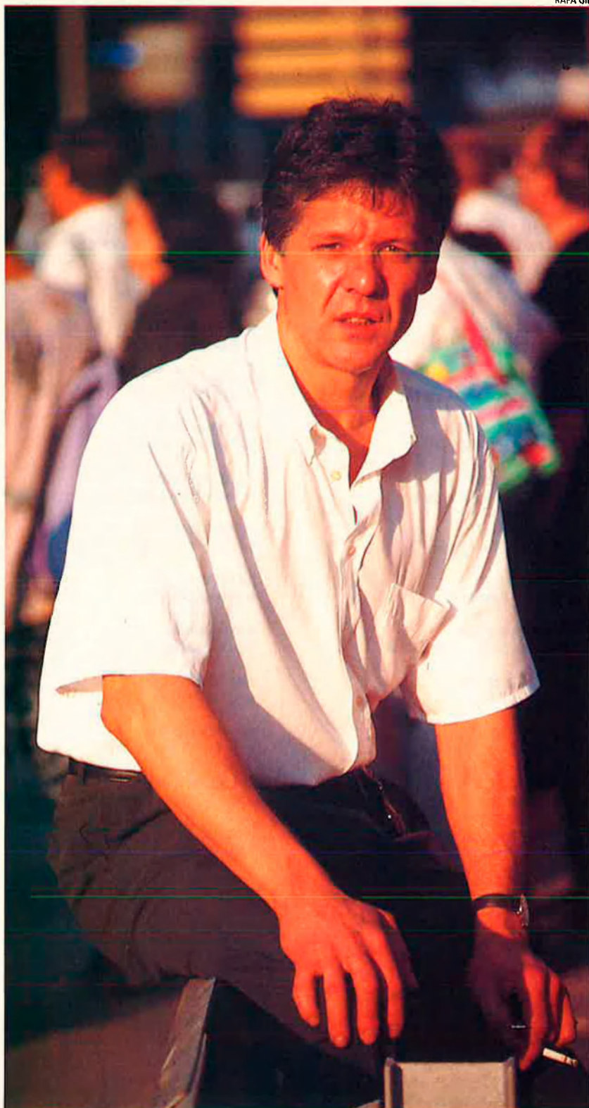
Francesc Cabanes i Pastor, el nom propi amb què la pilota valenciana ha travessat el llindar del segle XX. El Genovès tornà a vèncer a Sagunt.

L'esport nacional al País Valencià és la pilota, i el seu campió indiscutible és Francesc Cabanes: el Genovès, el mite.