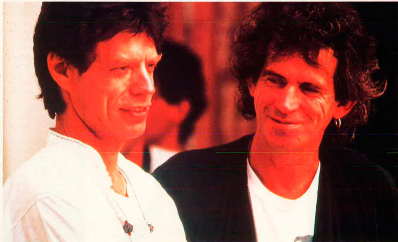
Keith Richards i Mick Jagger són els dos protagonistes d'un grup mític com els Stones. La seva relació d'amor i odi ha creat la tensió necessària perquè la seva música continuï als escenaris.