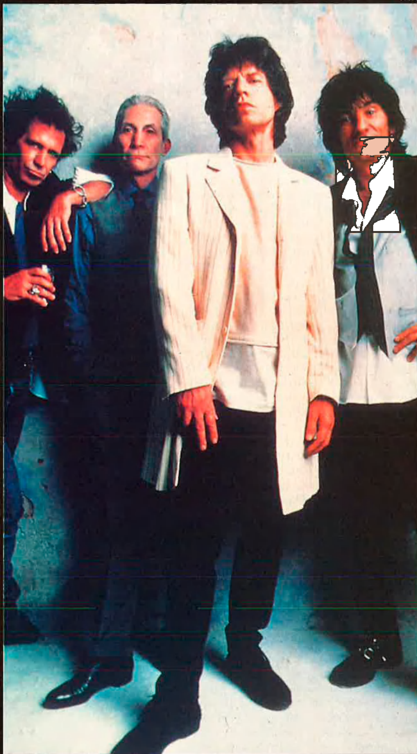
Els Rolling Stones han realitzat més d'una setantena de concerts durant aquesta gira. La presentació del seu darrer disc supera ja l'any.

S embla que quan els Rolling Stones van decidir de dedicar-se a la música professionalment, algú va aconsellar als joves Brian Jones i Keith Richards que, si volien triomfar, la primera cosa que havien de fer era desfer-se d'aquell cantant "amb uns llavis com matalassos". Afortunadament no li van fer gens de cas, i avui l'amable personatge deu fer trenta anys que es penedeix d'aquelles paraules. Els Stones (mai de la vida "Rollings"), sense el carisma, l'energia i, és clar, les composicions de Mick Jagger, segur que no celebrarien el mig segle de vida dalt els escenaris. Com tampoc no haurien arribat fins aquí sense l'obscur Keith Richards. Potser és que la relació d'amor i odi entre aquests dos músics ha creat una tensió que ha ajudat a fer viure els Rolling Stones fins a límits que ningú no podia preveure. Potser és que van donar el misatge oportú en el moment oportú. Segurament que són aquestes coses, i moltes més, la claus d'una formació legendària que continua mantenint, encara ara, la força i l'autenticitat, sense repetir-se, després de tants anys. Voodoo Lounge , el seu últim disc (de més d'una trentena que ja en tenen) és la millor prova que els Stones continuen vius del tot. I la setantena de concerts que ja han fet de l'última tournee —un any sencer—, és la prova que una colla d'avis encara pot fer vibrar el món. I si no, només cal preguntar-ho al miler de catalans que faran més de tres-cents quilòmetres per veure els Rolling Stones en directe.