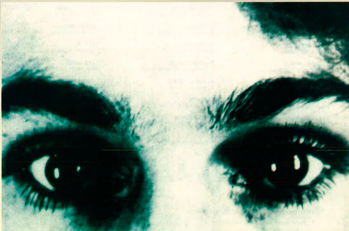
Elena Dimitrievna, altrament Gala. El poder del ulls de Gala es fa patent en la foto de Man Ray i Max Ernst.

Misteri, perversió glacial o, simplement, antipatia, són alguns dels qualificatius que han situat Gala entre el mite i la llegenda. Dominique Bona, en una extensa biografia publicada recentment per les edicions franceses Flammarion, revela l'enigmàtica figura de la dona que traspalsà els surrealistes.