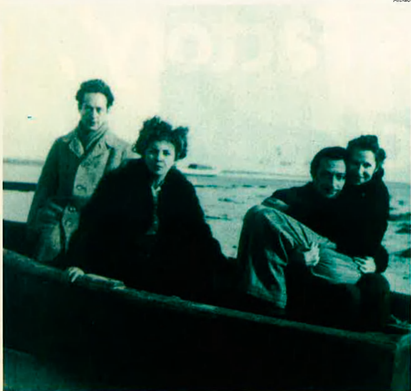
D'esquerra a dreta: Paul Éluard, una amiga, Salvador Dalí i Gala.

ta del seu imaginari s'emmotlla en el marc industrial. Joies, articles decoratius, tot un merchandising , al capdavant que Dalí signa i executa a canvi de l'èxit econòmic, el motor del qual és el silenci materialista de Gala. Estima els diners per sobre de tot. Però no com a traducció del luxe o com a arma poder. La seguretat que li ofereix el capital altera, fins a l'avarícia, el seu vessant estalviador. Davant la mirada dels artistes que sí que han treballat per una causa noble, res a veure amb l'expansió econòmica, Gala es forja una imatge de dona sense cor, àvida de diners, guardiana del patrimoni, guanyat a pes pels tractes amb una clientela de luxe.