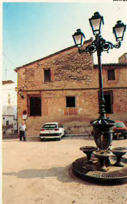
Casa dels Vilalonga, construïda el 1608 i conservada amb pulcritud.

50 anys servint els Villalonga. Servir els Villalonga és un ofici que ja havia fet sa mare, que va morir als 102 anys. Fins i tot la mare de sa mare, que havia inaugurat la saga al Maset. L'any 39, només acabar la guerra, Fina Hueso va anar de Figueroles a València, al domicili d'Ignasi Villalonga a fer les faenes de la casa,