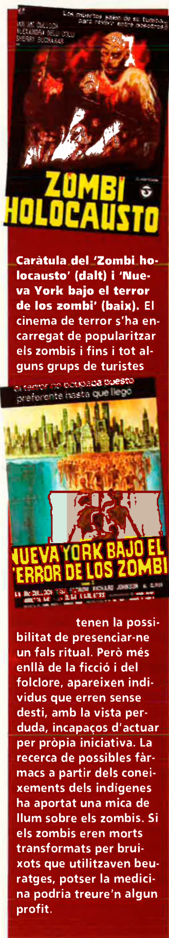
Caràtula del 'Zombi holocausto' (dalt) i 'Nueva York bajo el terror de los zombi' (baix). El cinema de terror s'ha encarregat de popularitzar els zombis i fins i tot alguns grups de turistes

El terror no botaba el esto prefereente hasta que llego