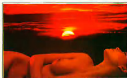
Isla de Mallorca