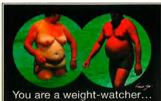
ISLA DE MALLORCA