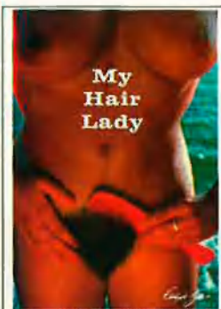
ISLA DE MALLORCA