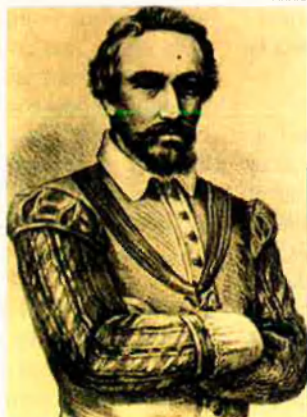
Al costat, el lloctinent Dalmau Queralt, màxim representant del rei, mort durant la revolta. Baix, el comte-duc d'Olivares coronant Felip IV en una Allegoria de Giovanni Battista.

En un altre sentit, és present, al llarg de les centúries modernes, el debat al voltant de la llengua de predicació. Cal tenir en compte que el Concili de Trento havia imposat l'exigència de la prèdica, o sermó, a la missa i havia assenyalat que aquesta –a diferència de la resta de la litúrgia– havia de fer-se en la llengua del país. El debat sobre la llengua de predicació ha de ser entès, però, en un context més ampli: el del prestigi creixent de la llengua castellana, aleshores en el seu Siglo de Oro . Al capdavant –com havia assenyalat, força abans, Nebrija–, la