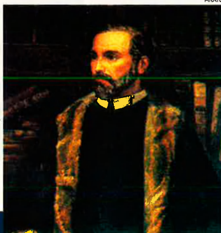
Pau Claris fou el líder indiscutit de la revolució popular. El president de la Generalitat es va oposar a l'intervencionisme reial.

Pau Claris i Casademunt (Barcelona, 1586-1641) havia nascut en el si d'una família de juristes i havia estat batejat a