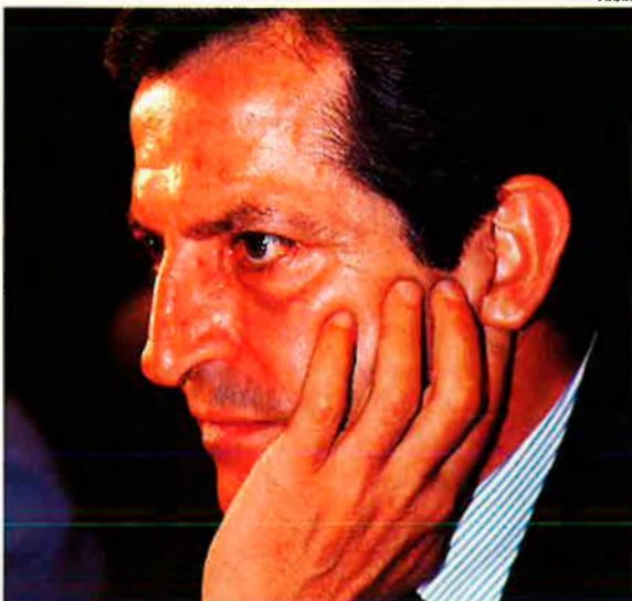
Adolfo Suárez, ex-president espanyol. Va compareixer voluntàriament en l'afer Banesto.

Els que hem conegut Adolfo Suárez, fins i tot molt temps abans de la seva nominació com a president del Govern central, no hem tingut la menor sorpresa per la seva reacció davant d'una informació que, sens dubte, afecta la seva