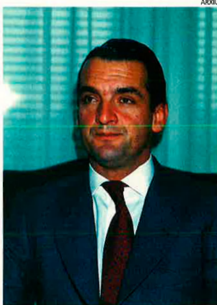
Mario Conde. Ara, ataca González.

Però ara Manglano ha tocat fons, quan s'ha sabut que el CESID, emparant-se en un discutible buit legal, escoltava les converses fetes des de telèfons mòbils, enregistrant personatges tan diferents com membres del PSOE, empresaris, periodistes o el rei i tot. I la versió que darrere les