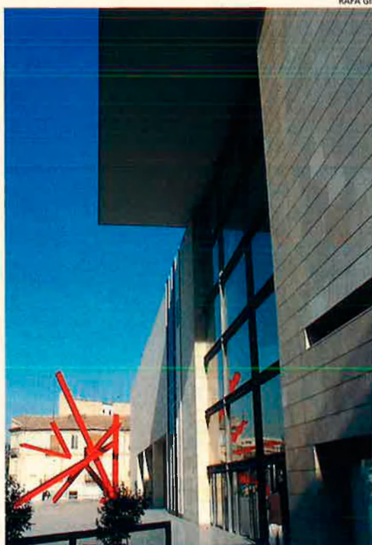
El fons de l'Institut Valencià d'Art Modern. En sis anys, ha aplegat 3.500 peces pròpies i 1.500 de cedides.