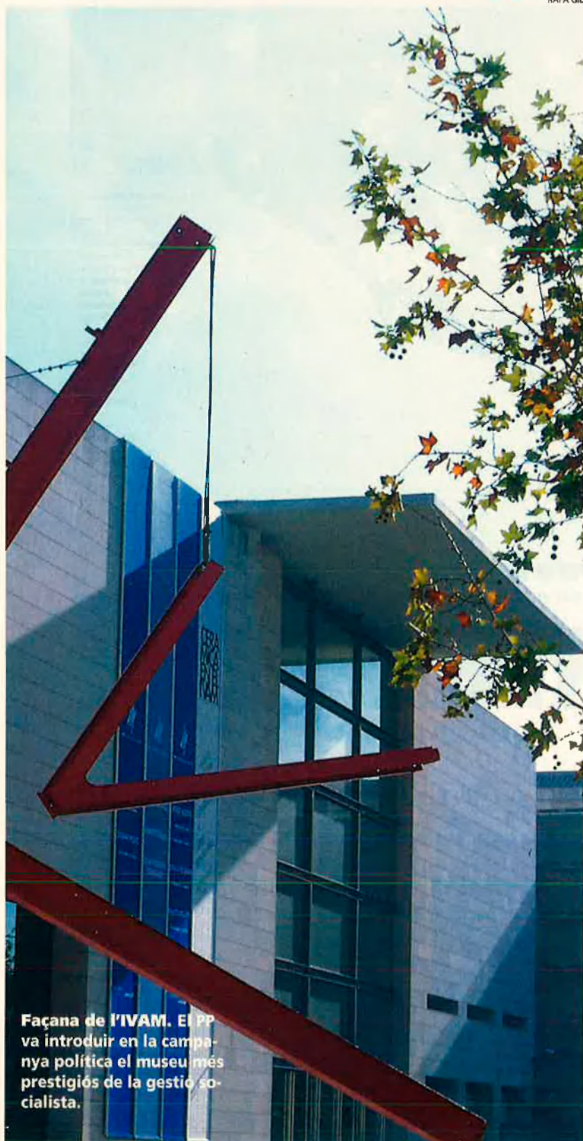
Façana de l'IVAM. El PP va introduir en la campanya política el museu més prestigiós de la gestió socialista.