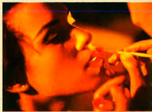
Dalt, la sessió de maquillatge. Baix, els periodistes parlen amb la mare de Francis.