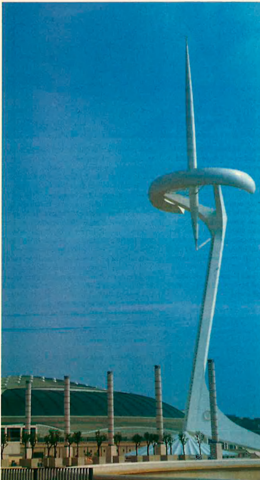
Un dels cims més representatius de Barcelona. La Torre de Calatrava vigila l'arribada d'un segle XXI engrescador.

Angoixada per la manca d'espai físic i amb la voluntat de ser capital cultural, Barcelona es disposa a entrar al segle XX.