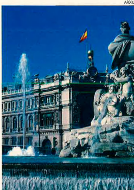
El Banc d'Espanya. Ha actuat amb autonomia.

E l Banc d'Espanya disposa d'una llei d'autonomia des del mes de juny del 1994. Una llei que no és cap caprici del govern central, sinó l'aplicació estricta, en aquest terreny, del Tractat de Maastricht que, per lluitar millor contra la inflació dels països membres de la Unió Europea, va establir l'autonomia d'uns bancs que, a tots els països, havien estat a les ordres dels governs, sempre dominats pel curt termini i per les pressions d'ordre electoral. Aquí la cosa no ha estat entesa com cal. I si no, vegin els comentaris de tot ordre que ha suscitat la recent disposició del Banc d'Espanya, d'augmentar el tipus d'interès del 8,50% al 9,25%. Hi ha comentaristes —especialment els catastrofistes a sou— que han donat la clau de la interpretació: tot és degut al fet que el banc no disposa d'una veritable autonomia, ans continua a les ordres del govern socialista. No s'ha deixat d'afirmar que el governador del Banc d'Espanya, professor Luis Ángel Rojo, ha actuat sota els dictats del govern, primer deixant per a més endavant l'adopció de la mesura per no pertorbar l'atmosfera de les eleccions del 28M; segon, posant de nou la responsabilitat