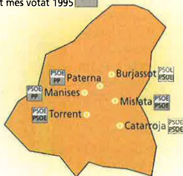
Partit més votat 1991 Partit més votat 1995

S'han acabat les majories absolutes i la coalició liderada pel Partit Comunista exigirà, sens dubte, un tomb cap a l'esquerra en la política municipal. En alguns d'aquests municipis, com Burjassot, la col·laboració no serà gens fàcil, ja que durant la passada legislatura, l'actitud dels barons socialistes, no ha fet cap con-