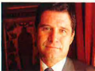
José Luis Gimeno (PP) ha superat la barrera del 50% de vots en més de 3 punts.