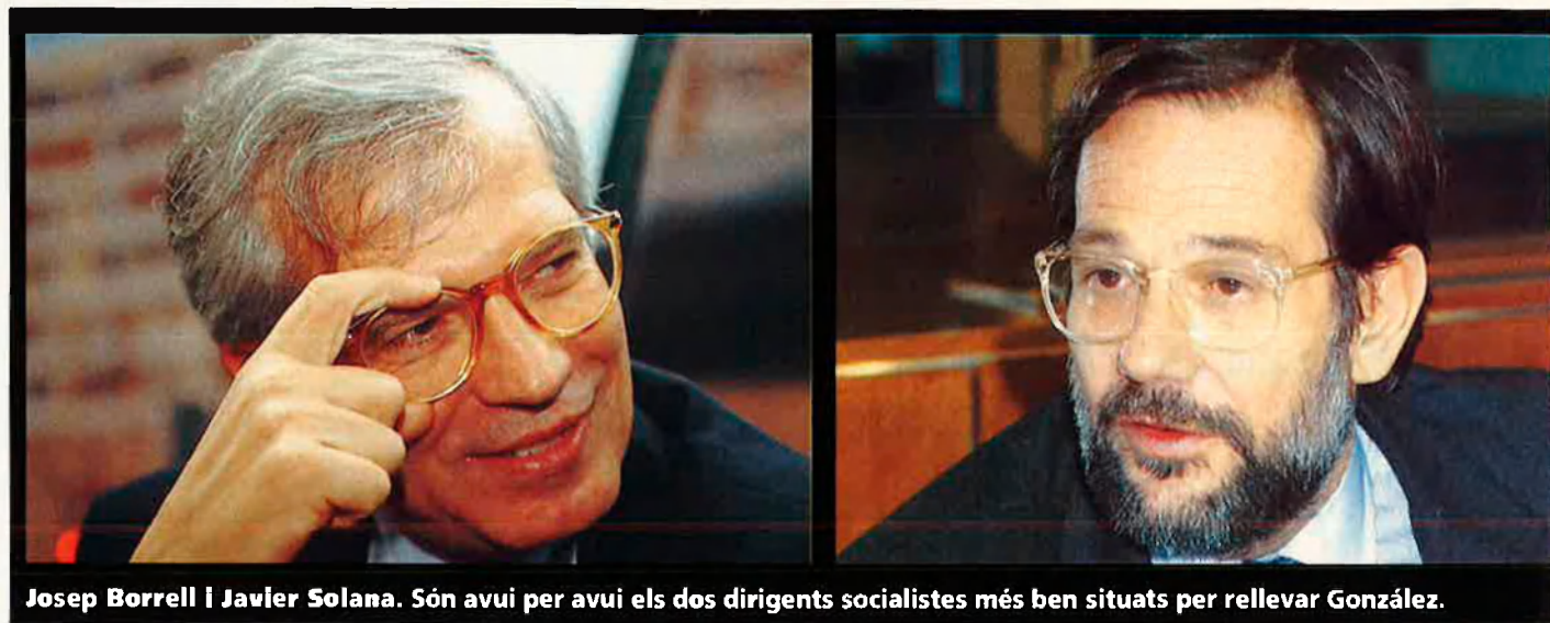
Josep Borrell i Javier Solana. Són avui per avui els dos dirigents socialistes més ben situats per rellevar González.