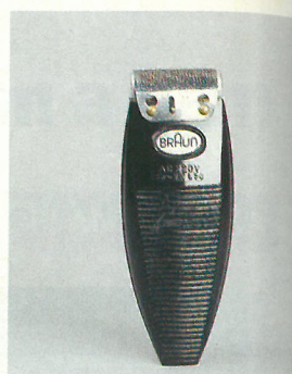
Marques com AEG, Electrolux, Siemens, Miele, Philips i altres són presents en l'exposició. A través d'alguns dels seus productes més significatius.