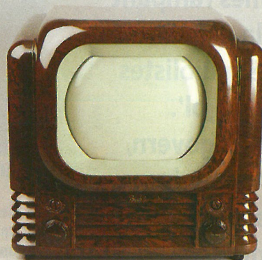
Imatges de la mostra. L'exposició té com a objecte presentar l'impacte de la tecnologia en la vida quotidiana.