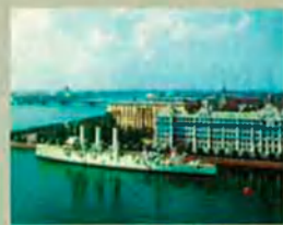
St. Petesburg, capital de Rússia, on Verdaguer trobà un poble "pobre i esclavitzat per la tirania dels Tsars".

Des de Berlín, en el curs del viatge per l'Europa central, fa una breu escapada a Sant Petersburg, travessant l'aleshores "inexistent" Polònia. En arribar a la frontera russa, confessa trobar-se "a la porta d'un altre món". A Rússia, "tot canvia de fesomia: el país i la gent, i tan de sobte que costa de