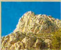
Muntanya de Montserrat. Motiu recurrent en l'obra del poeta.