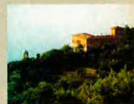
Miramar. Hi anà rere les passes de Ramon Llull.