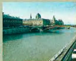
París. Hi feu una estada de deu dies el 1884.