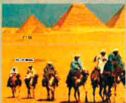
Piràmide de Khèops, a Gízeh. Verdaguer, tot pujant-hi hi evoca Montserrat.