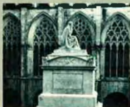
Claustre de la Catedral de Vic. En aquesta ciutat va cursar els estudis eclesiàstics.