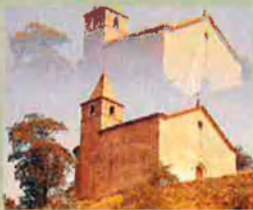
"Ermita al cel suspesa", on cantà la primera missa "entre un dolmen i un altar".

Hi neix, el 17 de maig de 1845, i hi passa la infantesa i l'adolescència. Referència habitual en la seva obra, la terra natal és el marc de moltes composicions del recull 'Aires del Montseny' (1901). La propera ermita de la Damunt li serveix de fons per al poema "L'arpa", romàntica declaració d'ambiciosos propòsits literaris. El 19 de juny de 1867, a la font del Desmai de la masia de la Torre de Morgadès, s'hi apleguen alguns dels components de l'Esbart de Vic, convocats per Verdaguer, que hi llegeix un "Parlament" en el qual, enllaçant poesia i naturalesa, en un marc perfectament idoni,