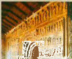
Portada del monestir: "La Bíblia al cor de Catalunya impresa".