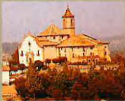
Santuari de la Gleva, prop de Vic. El poeta hi passa dos anys de la seva vida.