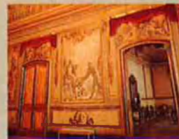
Sala central del palau Moja, a la Rambla. Verdaguer hi visqué més de quinze anys.

Uns altres escenaris significats en la vida barcelonina del poeta són: la Sala de Cent del consistori de la ciutat, marc dels seus grans èxits literaris (dues distincions als Jocs Florals de 1865, premi extraordinari per l'oda "A Barcelona" el 1883, mestratge en Gai Saber el 1880, discurs presidencial el 1881); l'Ateneu Barcelonès, aleshores a la Rambla, on el 1868, dolgut per no haver estat premiat als Jocs, rep l'encoratjament públic de Frederic Mistral: "Verdaguer, il faut être fier..."; el Teatre Principal, on rep el premi extraordinari dels Jocs Florals de 1877 per L'Atlàntida; el Teatre Líric, on pronuncia el discurs presidencial del Certamen Literari de Gràcia, el 1896; la Casa