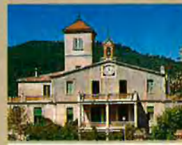
Vil·la Joana, a Vallvidrera. El poeta hi passa els darrers dies de la seva vida.