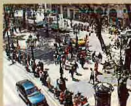
L'església de Betlem, vista des de la seva cambra al palau Moja. "Tants sofriments per passar d'una banda de Rambla a l'altra..."

El desembre de 1877 s'instal·la al palau Moja de la Rambla, on viurà més de quinze anys, però manté el que en diríem un estudi en un pis proper, on havia viscut els anys anteriors (carrer de la Canuda, núm. 14, 2n). Els altres domicilis barcelonins de Verdaguer