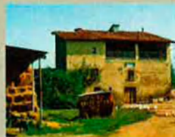
Masia de Can Tona. Hi escriví la primera versió de l'Atlàntida.