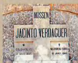
Tomba de Verdaguer al cementiri de Montjuïc. L'enterrament va ser multitudinari.

d'Oració del carrer dels Mirallers, on assisteix a sessions de vidents i practica exorcismes (maig 1890 - abril 1893); els Penitents, de Valldaroca, finca adquirida en subhasta pública (març 1892); i l'església de Betlem, on té un benefici eclesiàstic els darrers anys (febrer 1898 - maig 1902). Aquesta circumstància, cinc anys després d'haver deixat el proper palau dels Comillas i haver viscut un dramàtic enfrontament amb el marquès i amb el seu bisbe, li provoca un comentari irònic: "Tants sofriments per passar d'una banda de Rambla a l'altra..."