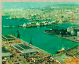
Alger. Verdaguer la visità atret per "lo món del color i de la fantasia".

A començament de 1883 fa un creuer d'una mesada pel Mediterrani en companyia del marquès de Comillas i mes personalitats del món industrial i financer. A bord d'un iot llogat pel marquès –el Vanadis–, visiten Tànger i Alger,