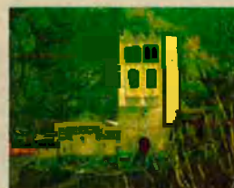
Sant Martí del Canigó. Les ruïnes del monestir inspiraren el poema "Los dos campanars".

Pel juliol de 1882 fa una excursió, de tres setmanes, pel Pirineu occidental (Alt Urgell, Pallars Sobirà i Vall d'Aran), que culmina amb una accidentada ascensió al pic d'Aneto. L'estiu següent emprèn, també a peu, un recorregut que el duu de Perpinyà a Andorra, passant pel Conflent, la Cerdanya, l'Alt Urgell, el Pallars Jussà, la Ribagorça, la Vall d'Aran i el País de Foix, on és detingut pels gendarmes, que el prenen "per un republicà disfressat, dels que van a moure la revolució en Espanya". Un exemplar imprès de