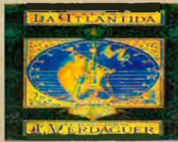
Coberta de l'edició Prínceps de l'Atlàntida (1878). Verdaguer enllestí el poema en les travessies atlàntiques.

El 1874 ingressa, com a capellà de vaixell, a la Companyia Transatlàntica del santanderí Antoni López, futur marquès de Comillas. A final d'any s'embarca, a Cadis, rumb a l'Havana. En dos anys, travessa divuit vegades l'oceà escenari del poema L'Atlàntida, que enllestí a bord del Guipúzcoa, d'on el baixa "salabrós encara i fent olor de quitrà i algues marines".