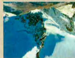
Pic d'Aneto, punt més alt del Pirineu. Verdaguer hi féu una accidentada ascensió el 1882.

l'oda "A Barcelona", encapçalada pel seu retrat, li serveix de document d'identificació. En el curs d'aquestes dues expedicions, fa replega de llegendes i tradicions, porta un extens dietari d'impressions excursionistes, anota termes lingüístics i denominacions orogràfiques, pren croquis d'indrets muntanyencs... Tot aquest bagatge li serà d'una gran utilitat per a la composició de "Canigó", poema eminentment geogràfic, el cant quart del qual és una transposició literària dels seus itineraris excursionistes.