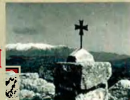
El canigó, des del Santuari del Mont. Verdaguier hi féu “llargues enraonades de cara a cara”.