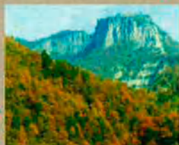
Cim del Matagalls, al Montseny. Iníci i final d'una trajectòria poètica.