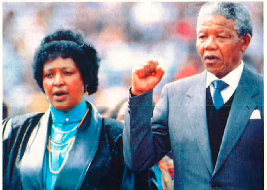
Mandela i Winnie. La radicalitat de l'esposa de l'ara president sud-africà va arribar a fer perillar els acords entre l'ANC i De Klerk.