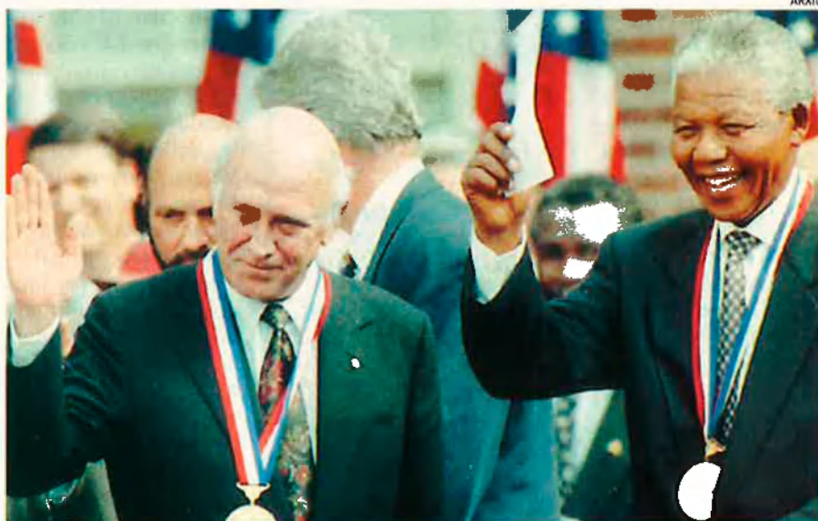
Mandela parafraseja Thatcher [sobre Gorbatxov]: "El senyor De Klerk era un home amb qui es podien mantenir negociacions."

Ell va afegir que no tenia interès a mantenir aquest concepte, perquè donava la impressió que el nou govern volguera modernitzar l' apartheid sense abolir-lo, i això hauria danyat la imatge del president i del seu partit als ulls de les forces progressistes del país i del món. Un sistema opressiu, va dir, no podia ser reformat, sinó que havia de ser abolit completament. Aquell dia em vaig adonar que De Klerk no reaccionava amb molta agilitat però sí que escoltava allò que els altres deien, encara que sense entrar en els detalls. "Ha d'entendre -va dir- que el meu objectiu no és diferent del seu. En el seu memoràndum a P. W. Botha, vostè escrivia que l'ANC i el Govern havien de cooperar per afrontar els temors dels blancs respecte al domini dels negres, i la idea dels drets de grup està precisament pensada per tranquil·litzar-los". La seua argumentació em va semblar creïble, però