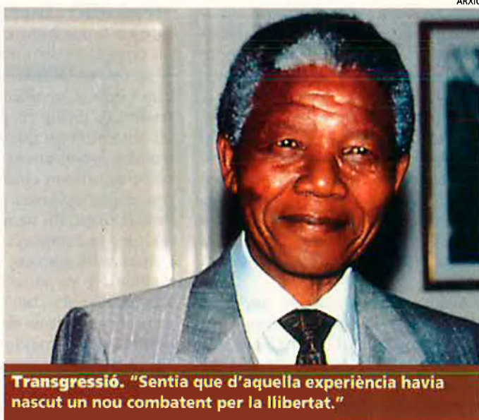
Transgressió. "Sentia que d'aquella experiència havia nascut un nou combatent per la llibertat."

Abans de la campanya en l'ANC es treballava més amb paraules que amb fets. No disposàvem de funcionaris remunerats, ni personal de cap tipus, i els nostres militants, generalment, es limitaven a subministrar un feble suport a la causa. A conseqüència de la campanya, els nostres afiliats van passar a ser cent mil. El Congrés Nacional Africà en va reeixir transformat en una vertadera organització de massa, amb un gran nombre d'activistes experimentats que havien afrontat policia, tribunals i presons. El fet de ser tancat a la presó no era considerat denigrant. Aquesta va ser una conquesta important, perquè la por de la presó hauria pogut ser un fort entrebanc en la lluita per l'alliberament. D'aleshores ençà, haver estat tancat a la presó es converteix per als militants en un motiu d'orgull.