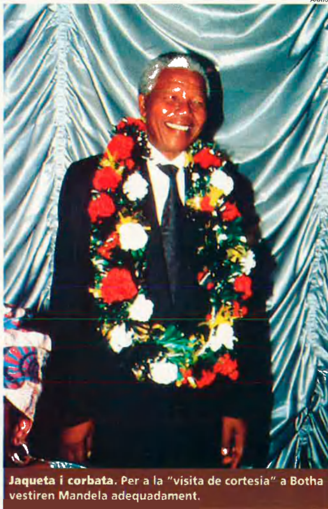
Jaqueta i corbata. Per a la "visita de cortesia" a Botha vestiren Mandela adequadament.

Vam acordar allò que havíem de dir en el cas que es filtrara la notícia del nostre encontre, i vam establir una vaga declaració: diríem que havíem quedat per prendre un te amb l'esperança de promoure la pacificació del país. Establerta aquesta fórmula, Botha es va alçar per